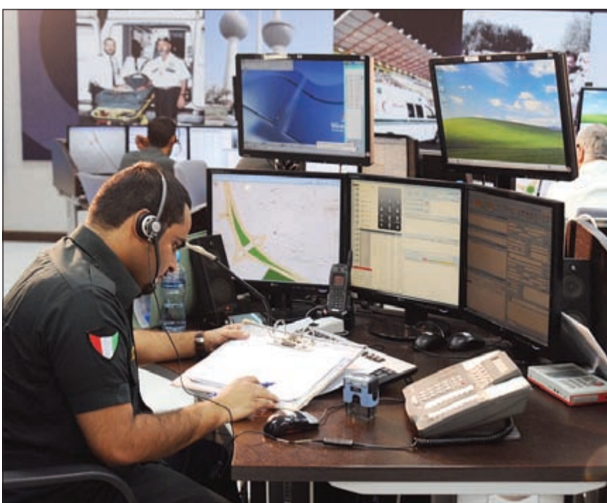
جاهزية واستعداد لرجال الطوارئ الفنية