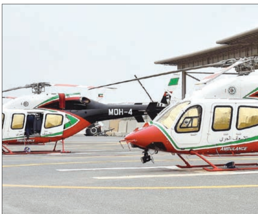
الإسعاف الجوي أتم جاهزيته

مشيدا بجميع العاملين في أقسام إدارة الطوارئ الطبية والفنيين على جهودهم المبذولة التي يقومون بها. واختتم الجسار تصريحه بتهنئة صاحب السمو أمير البلاد الشيخ صباح الأحمد وسمو ولي العهد الشيخ نواف الأحمد وسمو رئيس مجلس الوزراء والحكومة الرشيدة وجميع المواطنين بمناسبة عيد الأضحى المبارك.