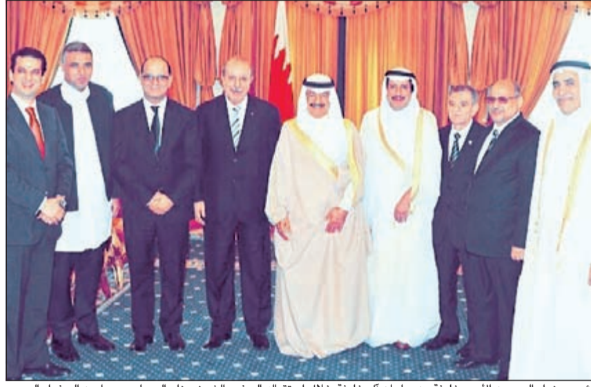
رئيس وزراء البحرين الأمير خليفة بن سلمان آل خليفة خلال استقباله السفير الشيخ عزام الصباح وعدد من السفراء العرب

المنامة - كونا: أكد رئيس وزراء مملكة البحرين الأمير خليفة بن سلمان آل خليفة أن الأمة العربية لديها القدرة على الوقوف مع حقوقها وحماية مصالحها متى ما تركت خلافاتها جانبا ووجهت دفة جهودها باتجاه العمل العربي المشترك الذي يحمي المنطقة من التدخلات الخارجية. وأضاف خلال استقباله عميد السلك الدبلوماسي سفيرنا لدى مملكة البحرين الشيخ عزام الصباح وعددا من السفراء العرب، شكره وتقديره لرئيس الوزراء نيابة عن السفراء العرب، مشيدا بما يلقاه السفراء من دعم وإسناد من أجل دعم وتعزيز العلاقات التي تربط دولهم بمملكة البحرين.