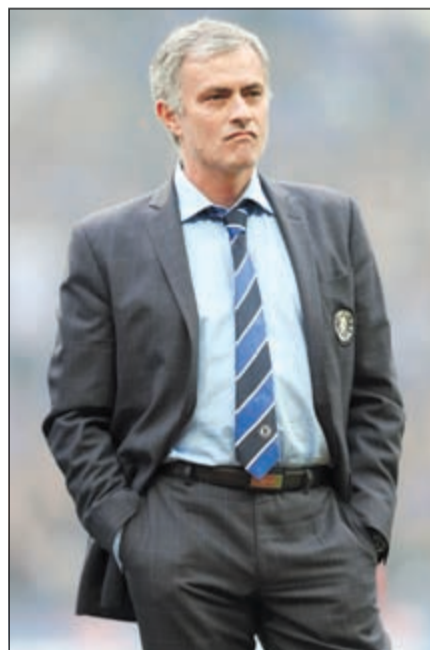
البرتغالي جوزيه مورينيو

أكد البرتغالي جوزيه مورينيو، المدير الفني لنادي تشلسي الإنجليزي لكرة القدم، انه سيجري تغييرات مهمة في تشكيلة الفريق الأساسية عندما يحل ضيفا على وال سال في اطار منافسات كأس الاندية المحترفة الإنجليزية اليوم. وقال مورينيو في تصريحات لوسائل الاعلام «تيري سيدأ المباراة، وستتم اراحة المهاجم ديبغو كوستا وتعويضه بالكلومبي الدولي راديميل فالكاو». وأضاف «تيري سيشارك في المواجهة بالطبع، اتمتع بعلاقة رائعة معه، والجميع يعرف انه رجلي الاول في تشلسي، وقائد لا مثيل له». وأشارت صحيفة «ميرور» الى ان مورينيو يسعى الى مصالحة اللاعب وارضائه الفترة المقبلة، خاصة ان له تأثيرا كبيرا على الفريق وعلى غرف خلع الملابس. وكان مورينيو قد فضل عدم الدفع بقائده المخضرم خلال مواجهة ارسنال في الجولة السادسة من البريميرليغ والتي انتهت بفوز البلوز بهدفين نظيفين على ملعب «ستامفورد بريدج».