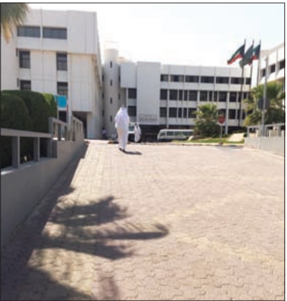
المرجعون اعتبروا يوم أمس إجازة فلم يقصدوا الجمع إلا بأعداد قليلة