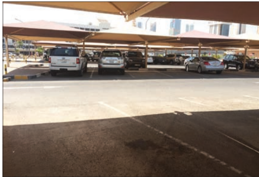
المواقف الخارجية لجمع الوزارات لم تشهد الازحامات المعتادة أمس

السبب في ذلك هو رغبة المرجعين في تجنب وقوع المعاملات المالية وإنجاز معاملاتهم قبل العيد، موضحا أن أعداد مرضيات الموظفين كانت نسبة قليلة جدا، مشيرا إلى ان الغيابات بطبيعة الحال كانت عبارة عن إجازات دورية مسبقة ولا تتعلق بالعيد.