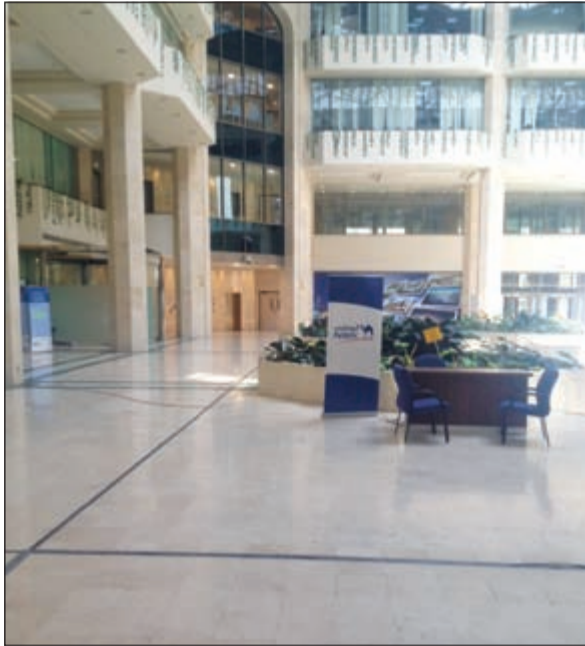
مدخل إحدى الكليات يبدو أمس وكان الكلية في عطلة رسمية