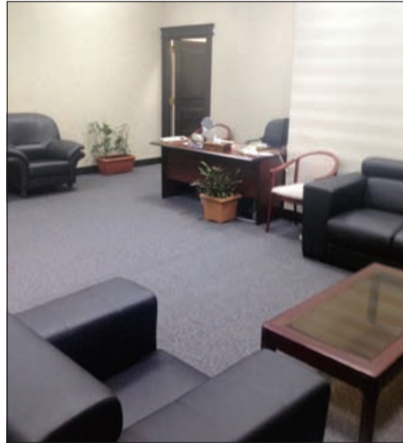
أحد المكاتب خال تماما من الموظفين والمرجعين