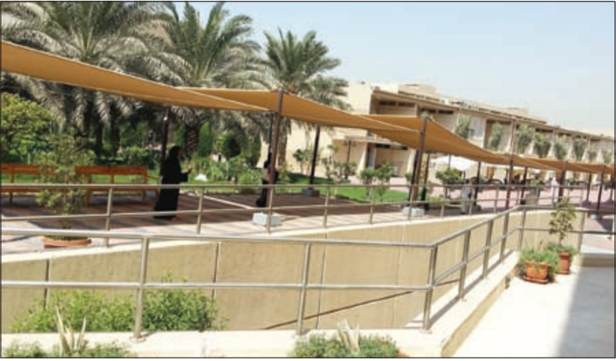
الساحات الخارجية خالية من الطلبة والأساتذة