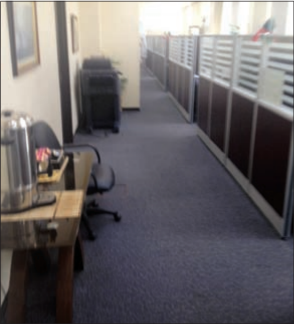
لا وجود للطلبة في كيفان