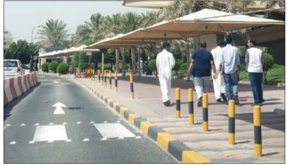
عدد محدود من الطلبة في الشويخ