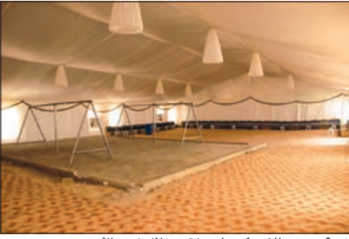
خيمة مجهزة للبيح كمنسج مؤقت خلال فترة الأضحي