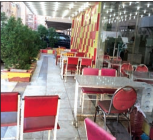
أحد مظاهر إشغالات الطرق

تحرص بلدية محافظة الفروانية من خلال تلك الحملات المحافظة على المظهر العام من خلال سعيها المتواصل لمكافحة المظاهر السلبية، وكافة الممارسات التي تهدد الساحات العامة وجوانب الطرقات، لاسيما وأن ظاهرة استغلال المساحات تشوه المنظر العام، فضلاً عن كونها ظاهرة غير حضارية تسيء للشكل الجمالي للشوارع والميادين والساحات، وتشكل مصدر إزعاج للجمهور، وتسهم في تلوث البيئة نتيجة إهمالها لفترات طويلة مما تعتبر مخالفة صريحة لقوانين وأنظمة البلدية، حيث شن فريق إشغالات الطرق بإدارة النظافة العامة وإشغالات الطرق بحملة تفتيش على المحلات المخالفة في منطقتي الفروانية وخيطان، هدفها إزالة كل ما يشوه المنظر العام بمحافظة الفروانية تشمل إزالة إشغالات الطرق سواء كانت بالساحات العامة أو المحلات والكراجات من منطلق الحفاظ على الوجه الحضاري للبلاد وتطبيق جميع القوانين واللوائح التي سنتها البلدية في هذا الخصوص، وأسفرت الحملة عن ضبط 11 بائعاً متجولاً، وتحرير 78 مخالفة تضمنت إشغال طرق واستغلال مساحة بدون الحصول على ترخيص مما تعتبر مخالفة صريحة لقوانين وأنظمة البلدية وفق القرار الوزاري رقم 149 الخاص بلائحة استغلال الساحات والأرصعة العامة والاستغلال التجاري.