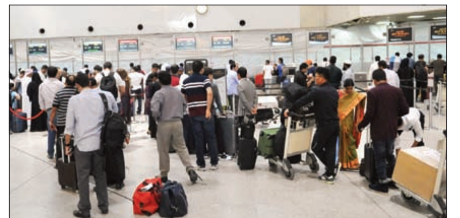
المسافرون بانتظار وزن الأمتعة قبيل مغادرتهم لقضاء العيد خارج الكويت

مدارس «التربية» خلت أمس من طلبتها، وشهدت غياباً شبه كلي في مختلف المراحل التعليمية ووصلت نسبة الحضور إلى 0٪ ولم يختلف المشهد كثيراً في المؤسسات الحكومية، حيث خلت الممرات والمكاتب من التكدس المعتاد للموظفين والمراجعين. وعلى صعيد السفر لقضاء العيد خارج البلاد، كشف مدير إدارة العمليات في مطار الكويت الدولي صالح الفداغي عن أن 89 ألف شخص سيغادرون مطار الكويت بداية من اليوم الأربعاء وعلى مدار 3 أيام، موضحاً أن دبي ومشهد وإسطنبول وبيروت والقاهرة هي أبرز وجهات المسافرين. ■ التفاصيل ص76