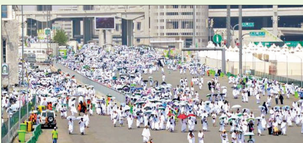
نحو مليوني حاج يؤدون ركن الحج الأعظم اليوم في عرفات بعد تصديدهم من مشعر منى

المطيري لـ «الأنباء»: 8000 كويتي موزعون على 46 حملة وتوزيع تذاكر قطار المشاعر على جميع حاجنا