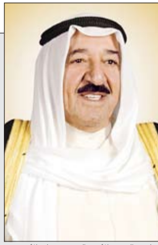
صاحب السمو الأمير الشيخ صباح الأحمد