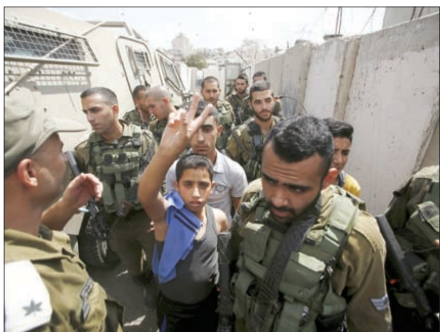
صبي فلسطيني يلوح بعلامة النصر في وجه جنود الاحتلال خلال اعتقاله بالضفة الغربية أمس

وتعارض هذه الخطوة التي صدقت عليها بلدية الاحتلال الإسرائيلي مع القانون الدولي الذي يمنع تغيير أسماء الشوارع في الأراضي المحتلة. ميدانيا، اعتقلت شرطة الاحتلال الإسرائيلية 24 فلسطينيا في القدس الشرقية بتهمة مشاركتهم في المواجهات التي وقعت خلال الأيام الأخيرة في مدينة القدس، كما أعلنت عن نشر آلاف من رجال الامن في البلدة القديمة مع حلول عيد الغفران اليهودي (الكيبور).