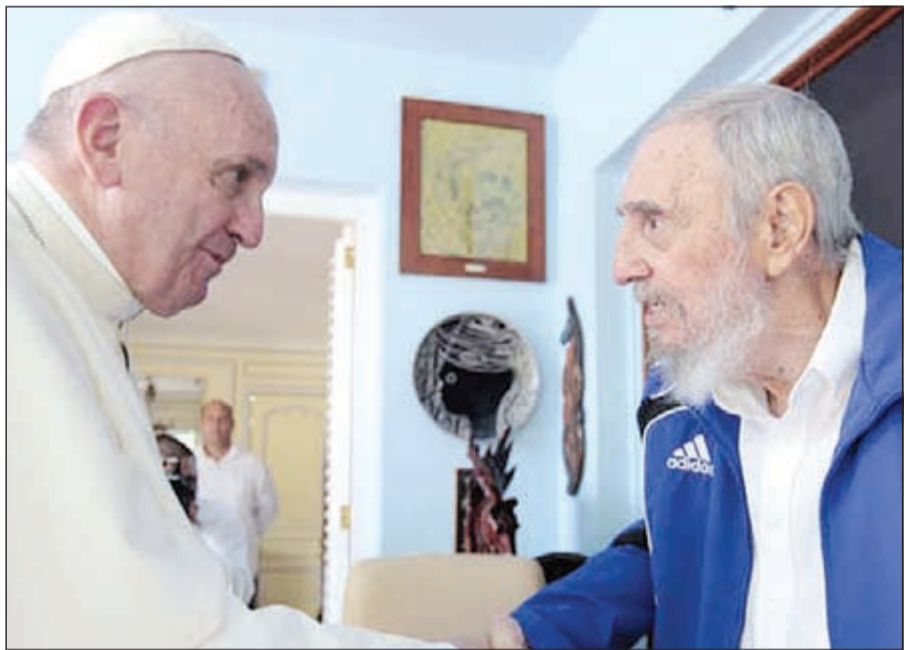
جانب من اللقاء «الودي» بين بابا الفاتيكان وفيدل كاسترو

بدورها أفادت صحيفة «جرانسا» التابعة للحزب الشيوعي الكوبي بأن فرنسيس وراؤول كاسترو ناقشا من بين أمور حالة العلاقات بين كوبا والفاتيكان، والتي استمرت دون انقطاع على مدى 80 عاما. وبعد لقائه بالزعيمين الشقيقتين توجه بابا الفاتيكان أمس الى هولوغوين إحدى نقاط انطلاق المسيحية في كوبا ومسقط رأسهما وذلك عشية