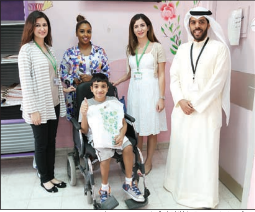
وفد البنك التجاري يقدم الهدايا للأطفال النزلاء في مستشفى مبارك