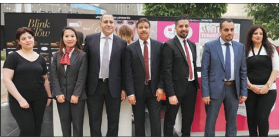
فريق عمل فيجن إكسبريس (قاسم باشا)