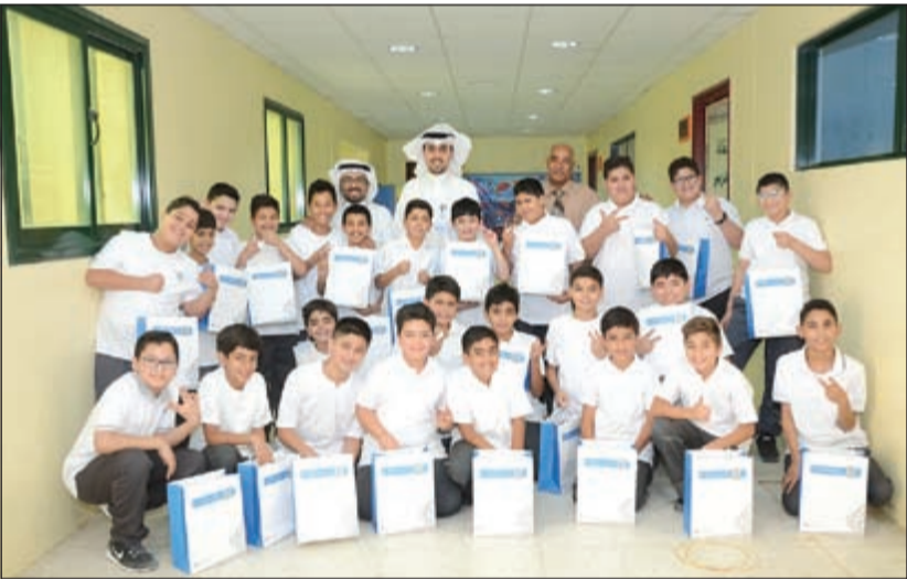
وفد بنك الكويت الدولي قدم الهدايا لطلاب مدرسة عبدالمحسن الخرافي

من جانبه، ثمن مدير المدرسة على الدعم جهود «الدولي» المستمرة في التواصل مع كل شرائح المجتمع الكويتي، معرباً عن امتنان المدرسة لإدارة وطلابها للالتفاتة المتواصل بزرع ابتسامته على وجوه أبنائنا ودعمهم ليكونوا مستقبلاً رجال الوطن وحماة ثقافته وتاريخه العريق. هذا، وقد قام السرحان بتقديم محاضرة مبسطة عن مهارات التوفير والإدخار وتوزيع هدايا متنوعة على الطلاب ضمن أجواء حملت الكثير من الألفة والتمنيات ببداية فصل دراسي مشرق. وتندرج هذه الزيارة ضمن الخطة الشاملة التي كان بنك الكويت الدولي قد وضعها وحرص على تطويرها لسنوات، بحيث تتوافق واستراتيجية البنك الاجتماعية الهادفة إلى ترسيخ صورة «الدولي» كمؤسسة كويتية تعنى بالشؤون التي تشغل حيزاً ملموساً من اهتمام المجتمع الكويتي.