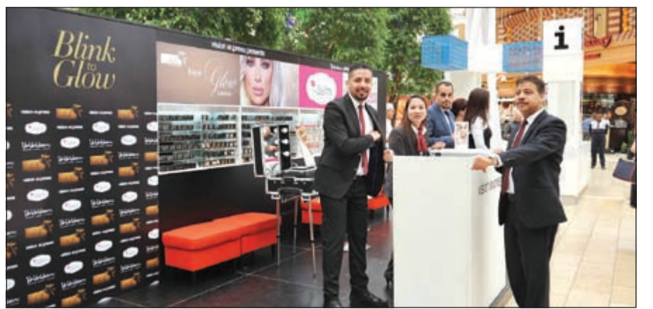
جانب من الحفل الذي أقامته «فيجن إكسبريس» لإطلاق العدسات الملونة

لمساعدة الحضور التعرف على أفضل الإطلالات المناسبة لهم. وتتوافر عدسات Glow الملونة لدى جميع محلات فيجن إكسبريس وسولاريس.