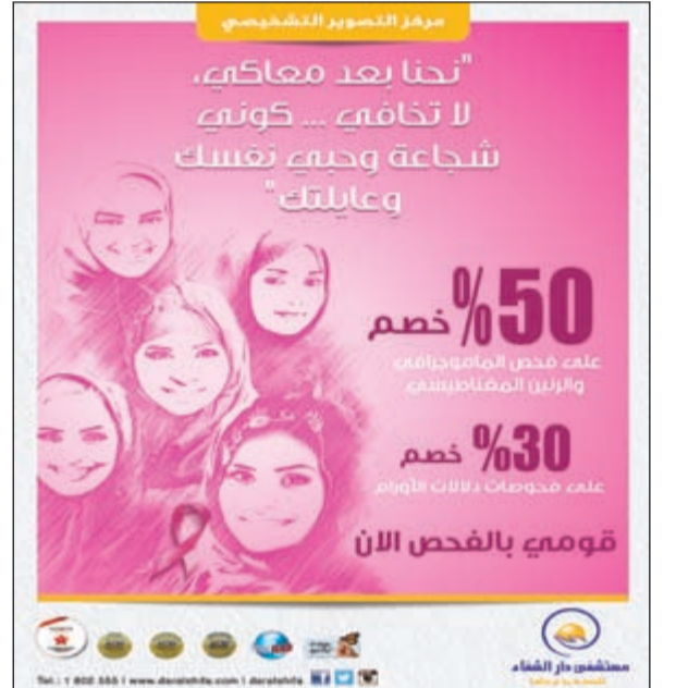
تخفيضات كبيرة من دار الشفاء