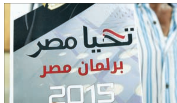
.. وبدأت معركة انتخابات برلمان 2015

هذا وأكد مجلس كنائس مصر أن جميع الكنائس لن تمارس أي دعوات أو توجيهات لأبناء الكنيسة في الانتخابات البرلمانية، مشيراً إلى أن مجلس كنائس مصر هدفه الأول والأخير التقارب بين الكنائس المصرية والصلاة من أجل الوطن.