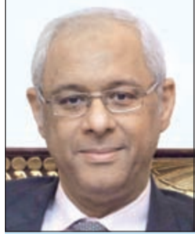
السفير ياسر عاطف