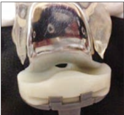
التحدث من دون الرباط الصليبي