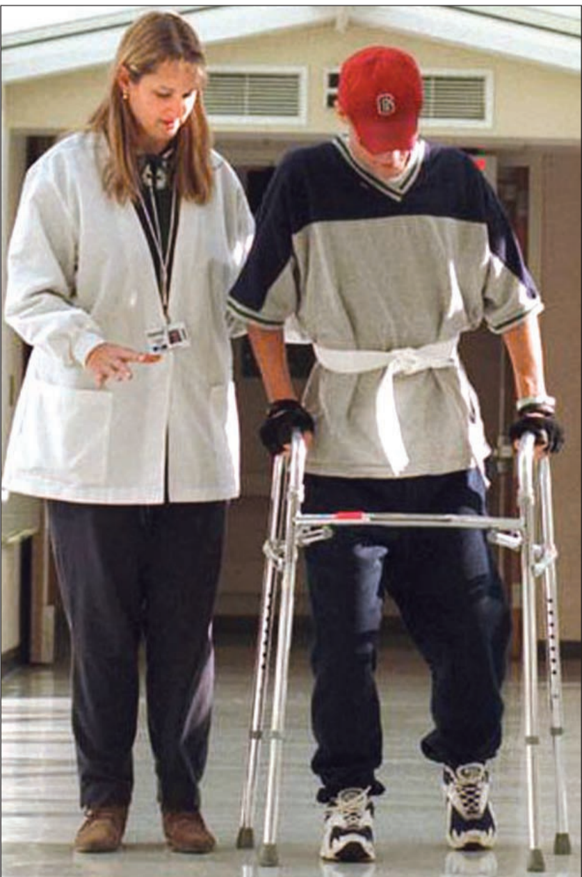
العلاج الطبيعي مباشرة بعد عملية الاستبدال

الجراحة تحافظ على الأربطة الطبيعية وخاصة «الصليبي» وثبات المفصل مصدره عدم الاعتماد على الأجزاء الصناعية