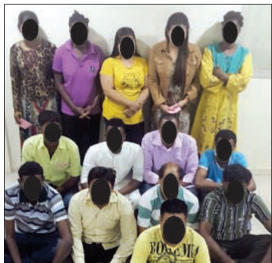
اعضاء الشبكة المتخصصة في التزوير وبعض المستفيدين