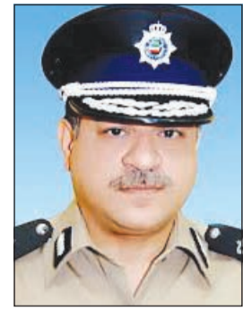
اللواء جمال الصايغ

من جهة أخرى، اتهم ملازمان من قوة النجدة 5 شباب كويتيين بإهانتهم على خلفية حادث مروري وقع في شارع التعاون، حيث طلب الضابطان من الشباب الابتعاد عن حادث سير، إلا ان الشباب الخمسة رفضوا واعتدوا بالضرب على الملازمين ليمت طلب إسناد، بعد تعليمات وردت بهذا الخصوص من اللواء جمال الصايغ.