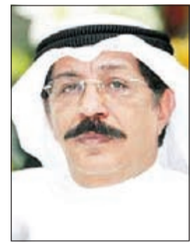
اللواء عبدالحميد العوضي