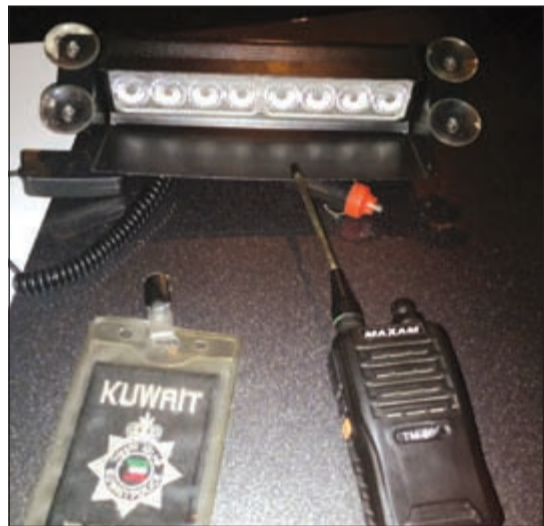
الاجهزة الشرطية المضبوطة

أخضع مواطن من مواليد 1991 لتحقيقات مكثفة من قبل رجال الإدارة العامة للمباحث الجنائية وذلك بعد ان تم ضبطه وبحوزته فلشر ولاسلكي، ويرجح مصدر أمني ان تسفر التحقيقات مع المتهم عن تورطه في قضايا سلب بانتحال صفة رجال مباحث، وبحسب مصدر أمني فإن المواطن تم ضبطه من قبل دورية وذلك بعد الاشتباه به خلال تجول الدورية في منطقة السالمية.