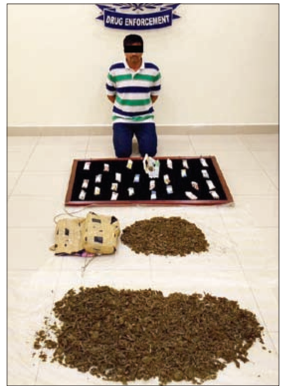
المتهم وامامه المضبوطات