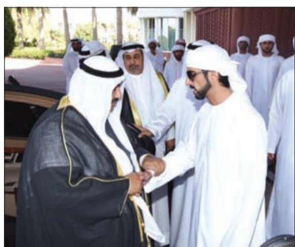
سمو الشيخ ناصر المحمد معزيا بوفاة راشد بن محمد بن راشد آل مكتوم