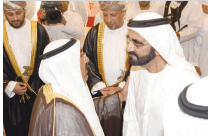
الشيخ ناصر صباح الأحمد معزيا الشيخ محمد بن راشد