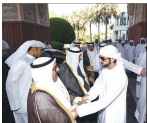
الشيخ ناصر صباح الأحمد خلال تقديم واجب العزاء

بن راشد آل مكتوم. وكان في استقبال ممثل سموه د. راشد أحمد بن فهد وزير البيئة والمياه وسفيرنا لدى الإمارات العربية المتحدة الشقيقة صلاح البعيجان. وكان ممثل صاحب السمو الأمير الشيخ صباح الأحمد سمو الشيخ ناصر المحمد ووزير شؤون الديوان الأميري الشيخ ناصر صباح الأحمد قد غادرا البلاد أمس متوجهين إلى دولة الإمارات العربية المتحدة الشقيقة لتقديم واجب العزاء بوفاة المغفور له بإذن الله تعالى الشيخ راشد بن محمد بن راشد آل مكتوم.