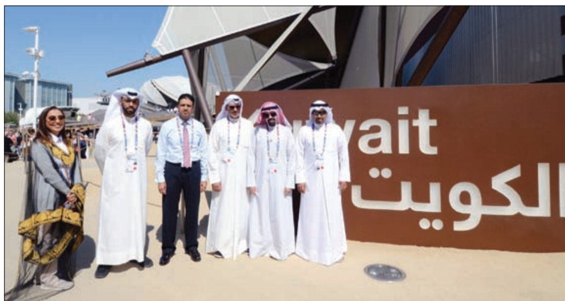
فريق «سنيار» في جناح الكويت في «إكسبو ميلانو»

أعلن مركز الكويت للعمل التطوعي الذي تترأسه الشبيخة أمثال الأحمد، مشاركة فريق الغوص «سنيار» التابع للمركز في معرض اكسبو ميلانو 2015 المقام في إيطاليا حاليا، مبينا أن الفريق شارك خلال الفترة من 3 إلى 8 الجاري، وأنها تعد المشاركة الأولى للفريق في المعرض، حيث قام الفريق بعرض أهم إنجازاته ومشاريعه في مجال البيئة البحرية.