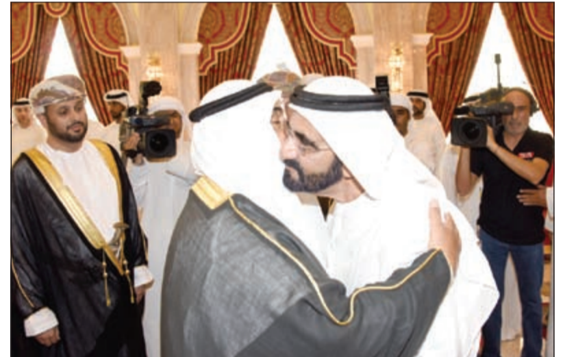
سمو الشيخ ناصر المحمد معزيا صاحب السمو الشيخ محمد بن راشد آل مكتوم