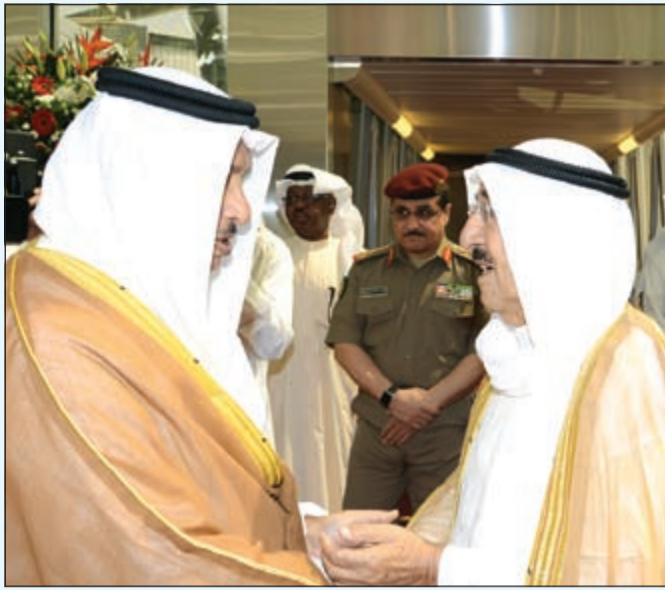
سمو الأمير مصافحا سمو رئيس الوزراء الشيخ جابر المبارك