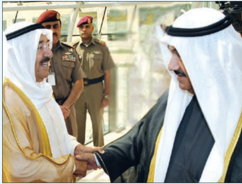
صاحب السمو الأمير مصافحا سمو الشيخ ناصر المحمد