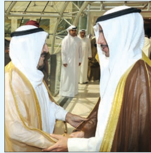
صاحب السمو الأمير الشيخ صباح الأحمد مصافحا مرووق الغانم

يحفظ الله ورعايته غادر صاحب السمو الأمير الشيخ صباح الأحمد والوفد الرسمي المرافق لسموه أرض الوطن صباح أمس متوجها إلى مدينة نيويورك بالولايات المتحدة الأميركية الصديقة وذلك لترؤس وفد الكويت في مؤتمر التنمية المستدامة للأمم المتحدة وقمة القادة لمواجهة التطرف العنيف. وكان في وداع سموه على أرض المطار سمو نائب الأمير ولي العهد الشيخ نواف الأحمد ورئيس مجلس الأمة مرووق الغانم وسمو الشيخ ناصر المحمد وسمو الشيخ جابر المبارك رئيس مجلس الوزراء ووزير شؤون الديوان الأميري الشيخ ناصر صباح الأحمد ونائب رئيس مجلس الوزراء ووزير الداخلية الشيخ محمد الخالد ونائب رئيس مجلس الوزراء ووزير المالية انس الصالح والوزراء وكبار المسؤولين بالدولة. ويرافق سموه وفد رسمي يضم كلا من النائب الأول لرئيس مجلس الوزراء ووزير الخارجية الشيخ صباح الخالد ووزير الداخلية الأمير أحمد فهد الفهد والمستشار الديوان الأميري محمد أبو الحسن ورئيس المراسم والتشريعات