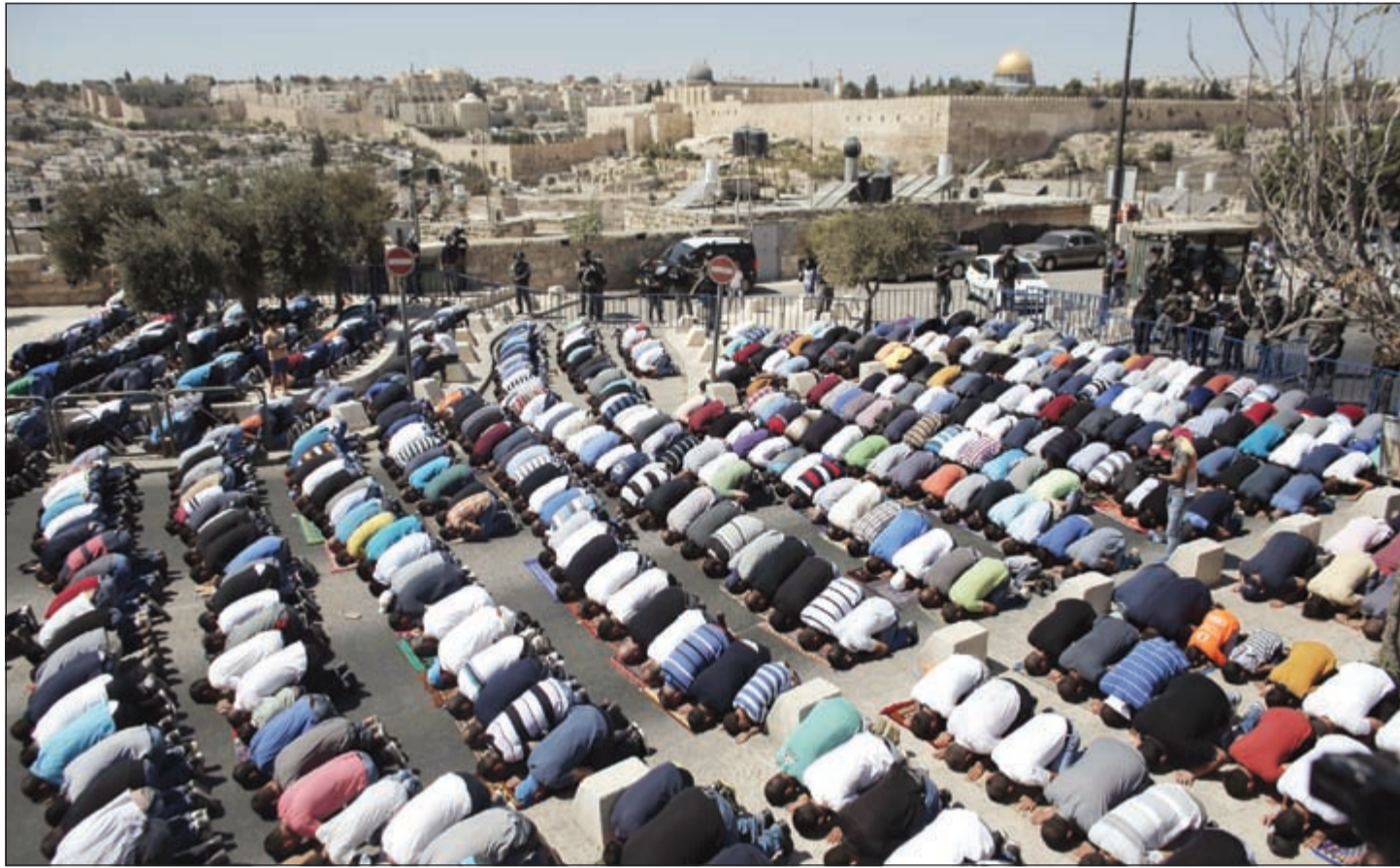
مئات المصلين الفلسطينيين اضطروا لاداء صلاة الجمعة خارج المسجد الأقصى بسبب القيود التعسفية للاحتلال في القدس امس (أ.ف.ب)

محمد علي الحكيم في تصريح صحافي عقب رئاسته أوباما تحدث مع خادم الحرمين عن اليمن والعنف في الأماكن المقدسة «القدس».