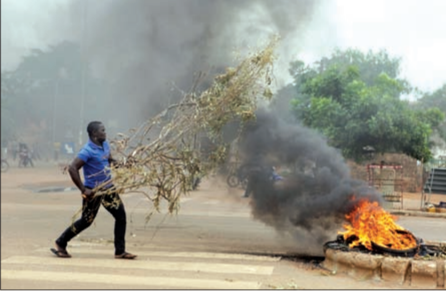
أحد المحتجين في بوركينا فاسو يشعل مزيداً من النيران اعتراضاً على الانقلاب العسكري في واجادوجو امس الأول

واغادوغو - وكالات: أعلن «المجلس الوطني للديموقراطية»، الهيئة العسكرية المسيرة للحكم في بوركينا فاسو، عن إطلاق سراح الرئيس المؤقت ميشيل كافاندو والوزراء المحتجزين بالقصر الرئاسي وواغادوغو عقب الانقلاب الذي قاده الحرس الرئاسي الموالي للرئيس المستقبل بلزين كيمباوري.