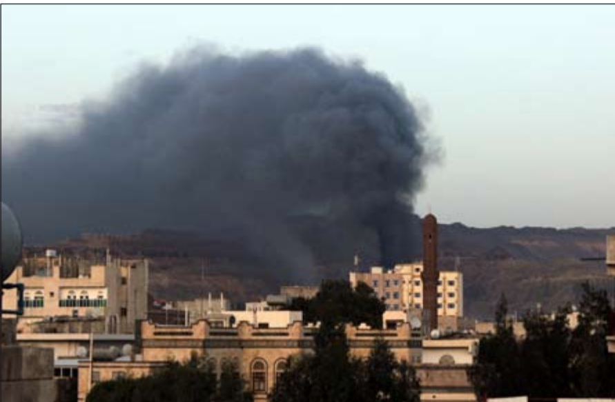
مدان كثيف متصاعد عقب استهداف طيران التحالف لمواقع الحوثيين في صنعاء امس

عواصم - إيباد احمد وكالات: أكد صاحب السمو الشيخ محمد بن زايد آل نهيان ولي عهد أبوظبي نائب القائد الأعلى للقوات المسلحة في دولة الإمارات العربية المتحدة، أن التحالف العربي بقيادة السعودية سيستمر في دعم ومساندة اليمن، ولن يسمح لعصابات متمردة على القيم الإنسانية والهوية العربية بأن تمارس بغيها وغنيها في الخاصرة العربية.