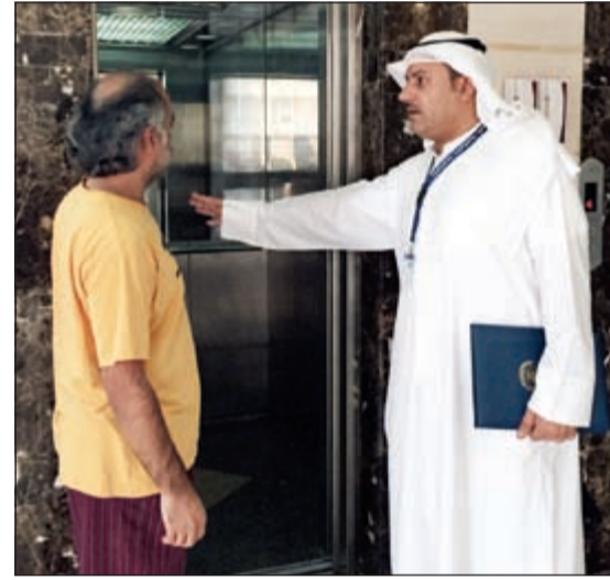
.. ومتابعة مقرات الحملات الكويتية

على مبادرته الكريمة لما لها من أثر طيب وتشجيع على العطاء والإبداع، يذكر أن الماجد قد نالت شهادة براءة