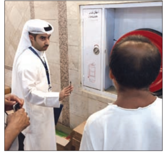
أحد ممثلي «الإطفاء» يطمئن على سلامة أجهزة الإطفاء