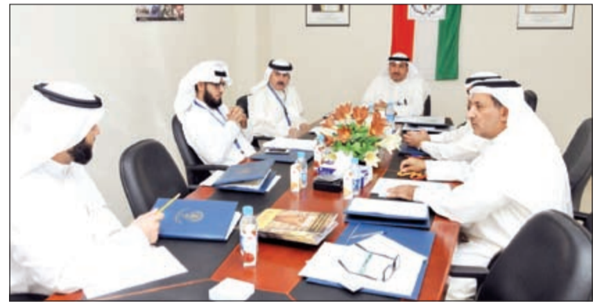
خليفة الأذنية مترسدا اجتماعا للتنسيق بين الجهات المعنية