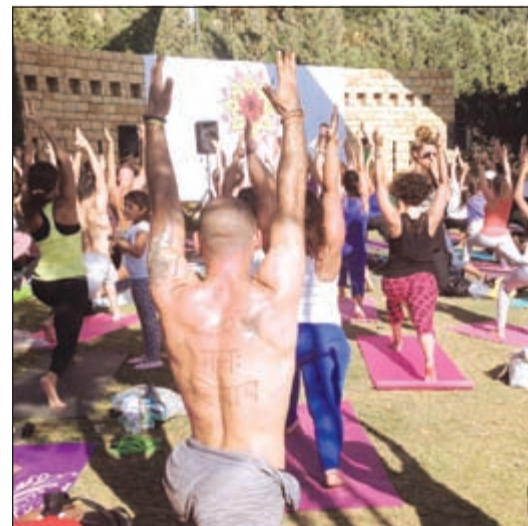
جانب من المهرجان

أما المعلمون فهم من الأكثر خبرة في لبنان ومن مدارس مختلفة في اليوغا كيوغا الهاتا التي تركز على التمارين الجسدية، ويوغا الكنداليني التي تحرك الطاقة الحيوية الكامنة في العمود الفقري، واليوغا نيدرا التي تضع الشخص