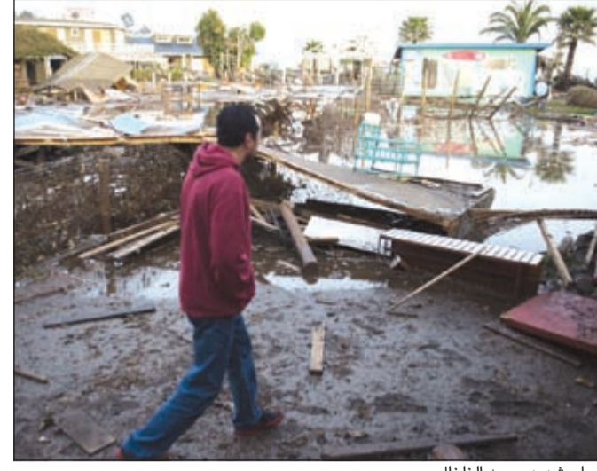
دمار شديد سببه الزلزال