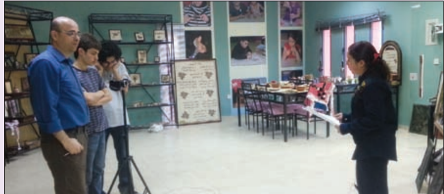
خلال التجهيز للعمل