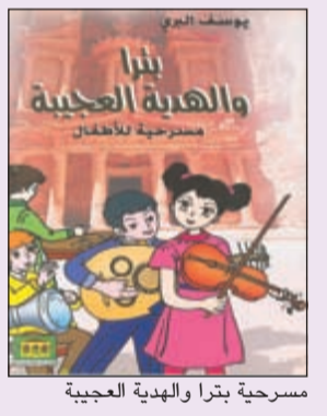
مسرحية بئرا والهدية العجيبة