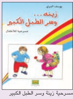
مسرحية زينة وسر الطبل الكبير