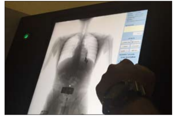
صورة الراكب على شاشة الجهاز

تدخل العنصر البشري، أن التطويرات الجمركية شملت جيلا جديدا من الوظائف التي