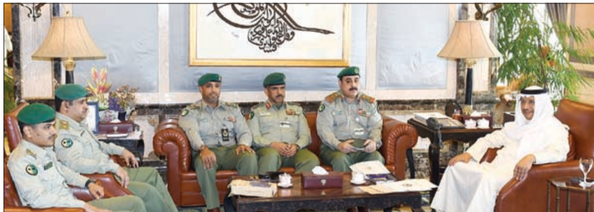
سمو رئيس الوزراء الشيخ جابر المبارك خلال استقبله الفريق الرفاعي وعدد من كبار ضباط الحرس

اطلع سمو الشيخ جابر المبارك رئيس مجلس الوزراء على مشروع منظومة الرصد الإشعاعي والكيماوي ومكونات المنظومة من حيث عدد وتوزيع محطات الرصد الإشعاعي والكيماوي لتغطية كل مناطق الكويت لحمايتها بتقديم بيانات عن نسبة الإشعاع أو الغازات في موقع كل محطة، كما اطلع سموه خلال استقبله امس الفريق الرفاعي وكيل الحرس الوطني يرافقه عدد من كبار ضباط الحرس. على عرض لتصميم وتجهيز عدد من محطات الرصد الإشعاعي المتنقلة والمزودة بأجهزة متطورة للرصد والكشف والتحليل إضافة إلى تقديم تقرير للإنذار المبكر قبل وقوع الحدث.