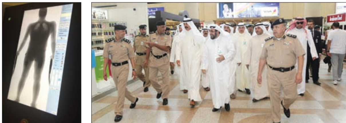
جانب من جولة نائب رئيس مجلس الوزراء ووزير الداخلية الشيخ محمد الخالد ووكيل الوزارة الفريق سليمان الفهد وقيادات الوزارة في المطار

مغادرتهم وحتى عودتهم إلى أرض الوطن سالمين. جاء ذلك خلال جولة تفقدية له في مطار الكويت الدولي رافقه فيها وكيل وزارة الداخلية الفريق سليمان الفهد، حيث تفقد الأجهزة الأمنية العاملة في المطار للوقوف على مدى جاهزيتها في التعامل مع الظروف والعطيات المختلفة، كما اطلع على