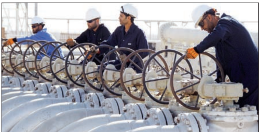
تواجه الصناعة النفطية وضعاً سلبياً خلال الفترة الباقية من العام الحالي

اتخاذها في 2016، وما زالت الشركات ماضية في اجراء تعديلات على مراحل تنفيذ مشروعاتها وتأجيل تلك التي تعتبر باهظة التكلفة في وقت تبدو فيه الافاق المستقبلية بالنسبة لانتعاش في اسعار النفط باهتة.