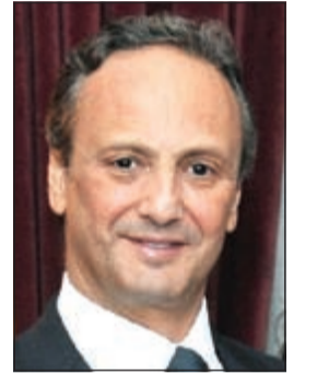
السفير الشيخ سالم العبدالله