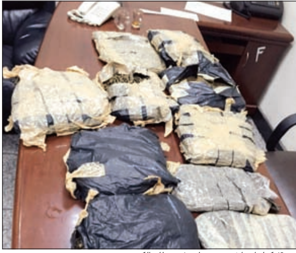
.. و 10 كيلوات أخرى ضبطت في مطار الكويت

أحال رجال الإدارة العامة لمكافحة المخدرات امس إلى النيابة العامة مواطنا في العقد السادس لتورطه في الاتجار في الحبوب المخدرة، وقال مصدر أمني أن المواطن من أرباب السوابق وقد وردت معلومات عن عودته للاتجار في المخدرات حيث تمت مصادرة منزله وعثر معه على 6500 حبة مخدرة كابتغون واعترف أمام ضباط المحاكمة بأنه يستعين بشركات شحن لجلب الحبوب والاتجار فيها لاحقا.