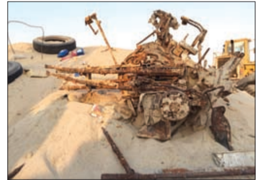
السلاح بدا متهاككا ومهملًا