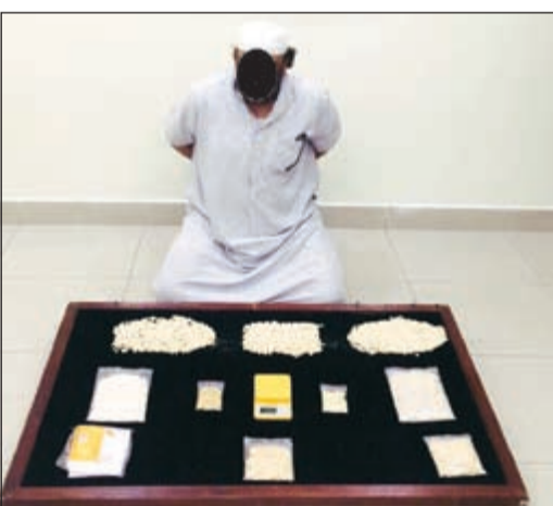
المتهم وأمامه الحبوب التي كان يتاجر بها