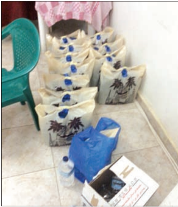
.. والمواد المستخدمة في تصنيع الخمر المحلي

نيابة الاحمدى كمية ضخمة من الخمر المعبأة والجاهزة للتعبئة والتي كانت داخل 216 برميلا. وكانت معلومات قد وردت الى وكيل وزارة الداخلية المساعد لشؤون الامن العام اللواء عبدالفتاح العلي عن قسيمة في اماكن السكن الخاص مؤجرة لصالح