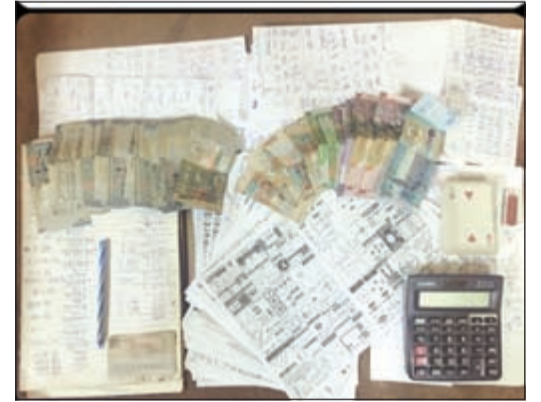
ادوات القمار والمبالغ المضبوطة مع المقامرین