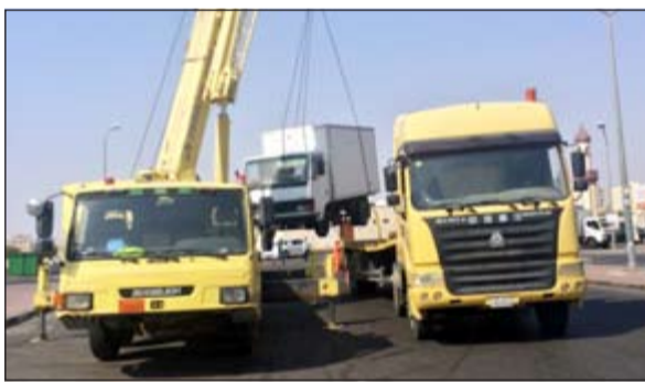
ونش البلدية يزِيل مركبة مهملة

المركبات وتمت ازالتها امس، وهناك مركبات مهملة أخرى ستزال تباعا. على صعيد حملات الامن العام فقد بلغت امس 83 حملة