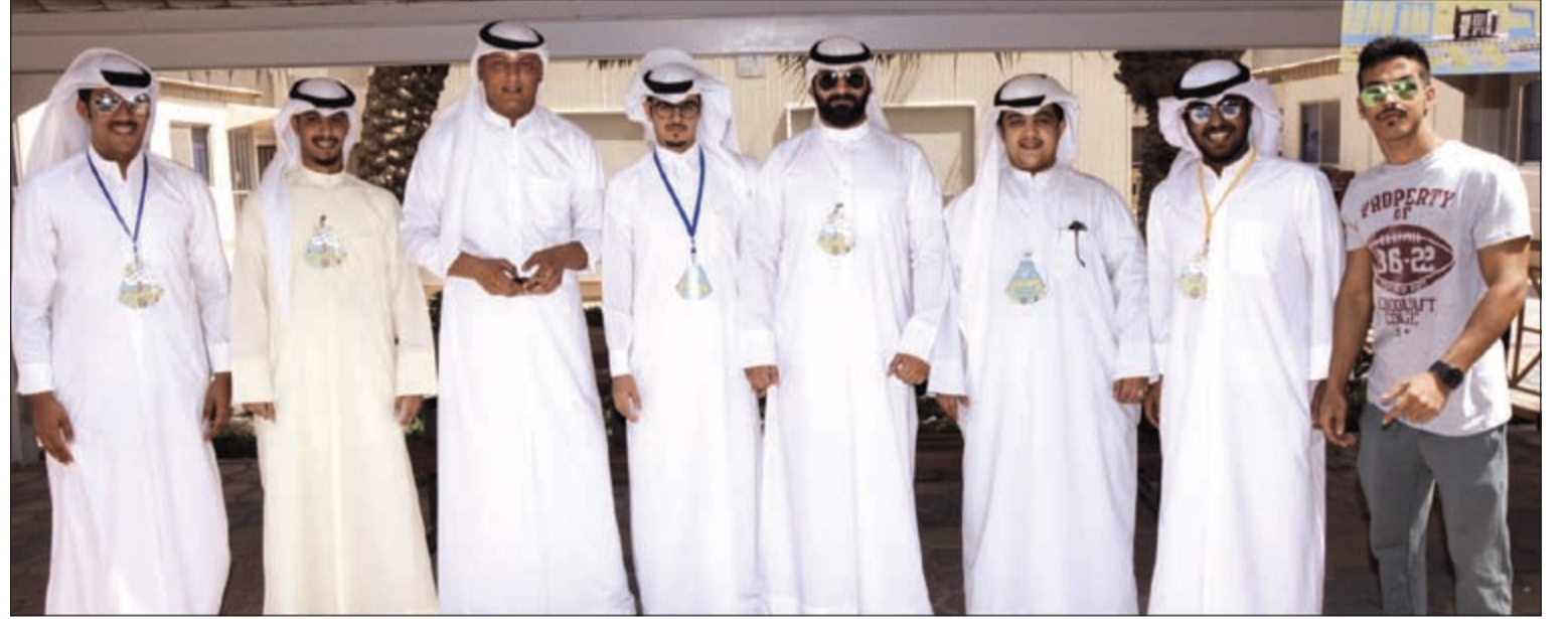
جانب من الطلبة المشاركين في العملية الانتخابية