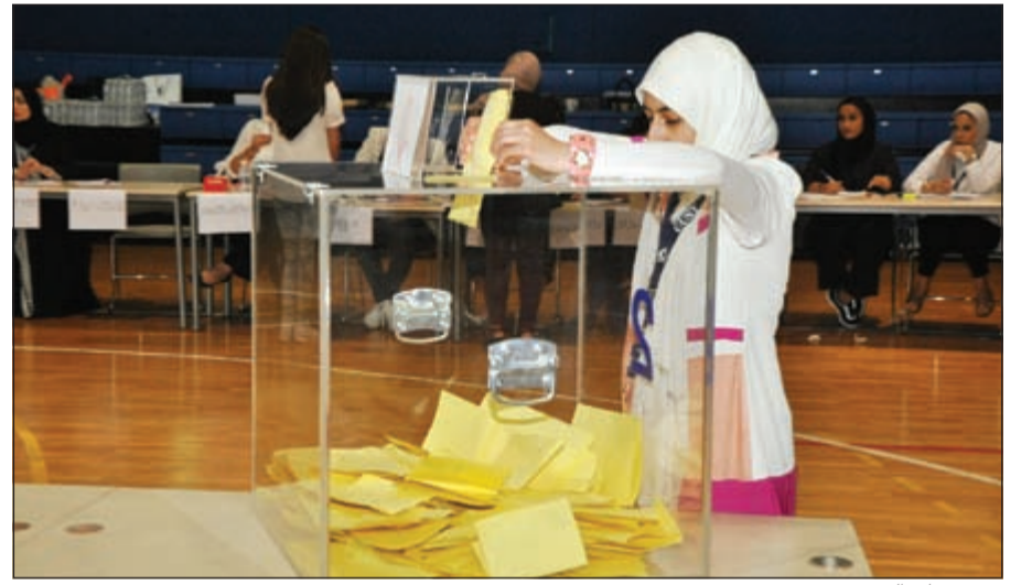
حرص على التصويت