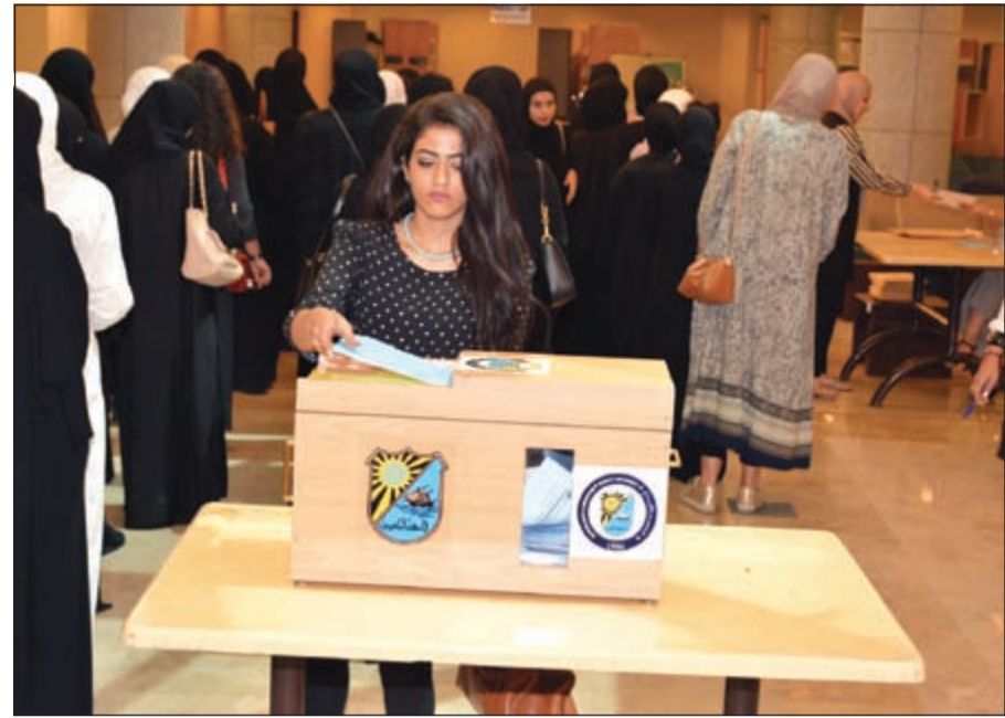
طالبة تدلي بصوتها في كلية العلوم الاجتماعية (ريليش كورنر)