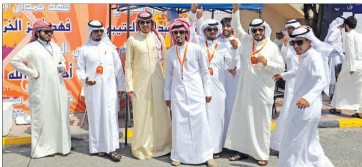
«التغيير»، حط رحاله في كلية الشريعة