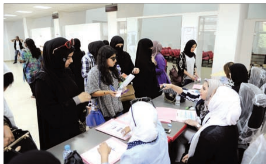
«التألف الطلابي»، حافظت على الصدارة في «الآداب»