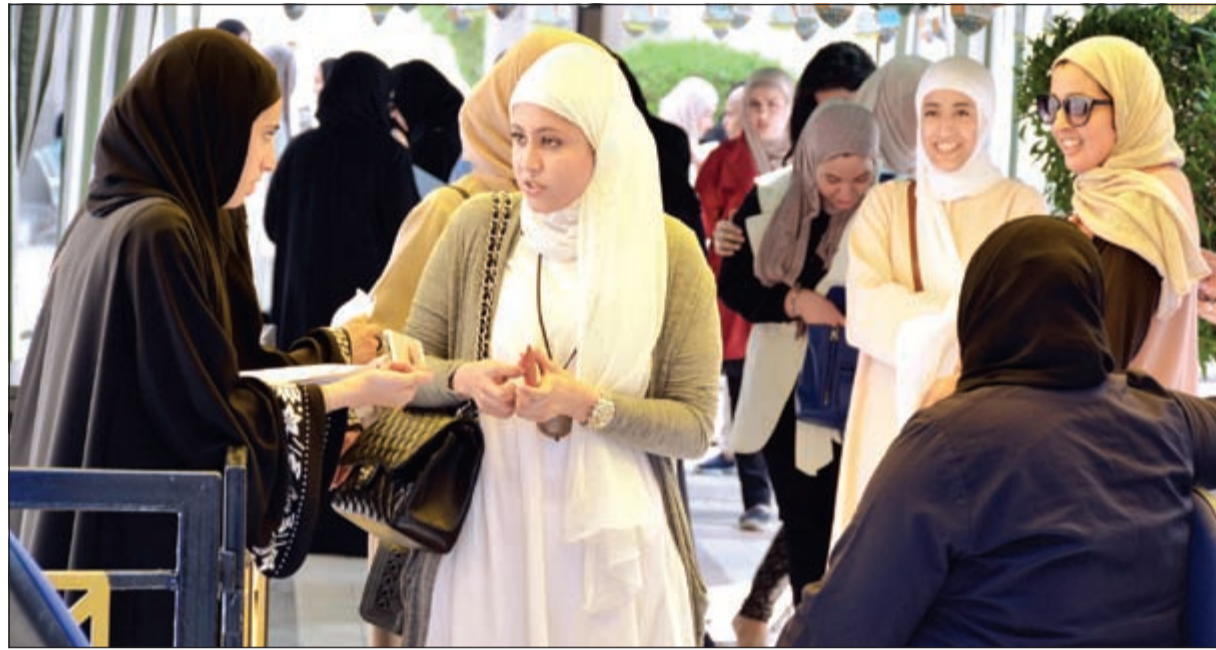
إصدار على المشاركة في «الإدارية»