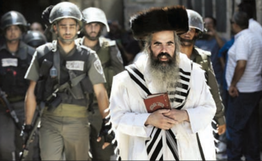
شرطة الاحتلال تقوم بحماية أحد اليهود المتطرفين في القدس بجانب الحائط الغربي