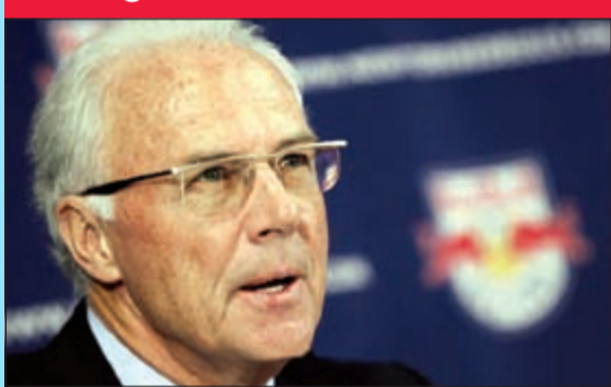
بيكنباور يتحدث عن الصراع

يرى اللاعب الألماني السابق فرانز بكنباور أن النسخة الجديدة من بطولة دوري أبطال أوروبا لكرة القدم ستشهد تنافسا محمومًا بشكل أكبر من الأعوام الماضية. وقال بكنباور الملقب بـ«القيصر»: «هناك العديد من المرشحين وهذا أمر لا يتكرر كثيرا. ستكون هناك مفاجآت قوية وفرق عملاقة في بطولة الأندية الأبرز على المستوى العالمي. وأشار بكنباور إلى أن فرق برشلونة وريال مدريد وبايرن ميونخ أبرز المرشحين كما جرت العادة دائما، مشيرًا في الوقت نفسه إلى أن فرقا مثل مان سيتي ومان يونايتد وتشلسي مازالت تمتلك القدرة على المنافسة، كما ألمح أيضا إلى إمكانية مزاحمة يوفنتوس الإيطالي للفريق الكبرى. ويعتقد الرئيس الشرقي لنادي بايرن ميونخ أن فريق باريس سان جيرمان الفرنسي يمكنه أن يحدث ضجة هذا الموسم في حال كان السويدي زلاتان إبراهيموفيتش يتمتع بأفضل حالاته الفنية.