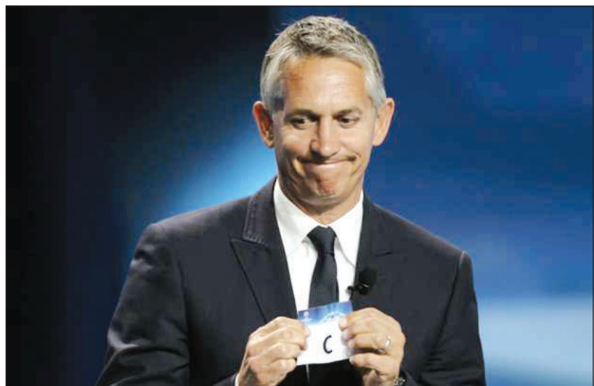
القناص الإنجليزي السابق يتحدث بواقعية

من المنافسة على الرغم من بدايته الصعبة هذا الموسم، لكنني متأكد من أنه سيتعافى، في حين لا أعتقد أن أرسنال سيذهب بعيدا في دوري أبطال أوروبا. لكنني أتوقع حصوله على أحد المراكز الثلاثة الأولى في البريميرليغ.»