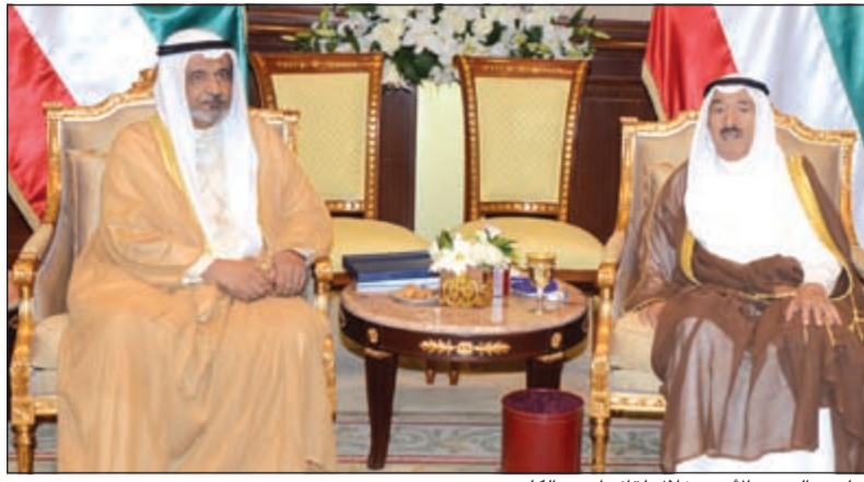
صاحب السمو الأمير خلال لقائه أحمد الكليب