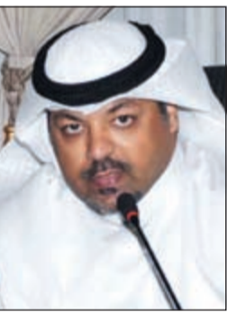
الشيخ يوسف العبد لله

وأضاف «اننا دائما نسير على توجيهات قادة دول المجلس بالعمل الخليجي المشترك منغمة لكافة أبناء دول مجلس التعاون» مبينا ان هذا التوحيد سينعكس