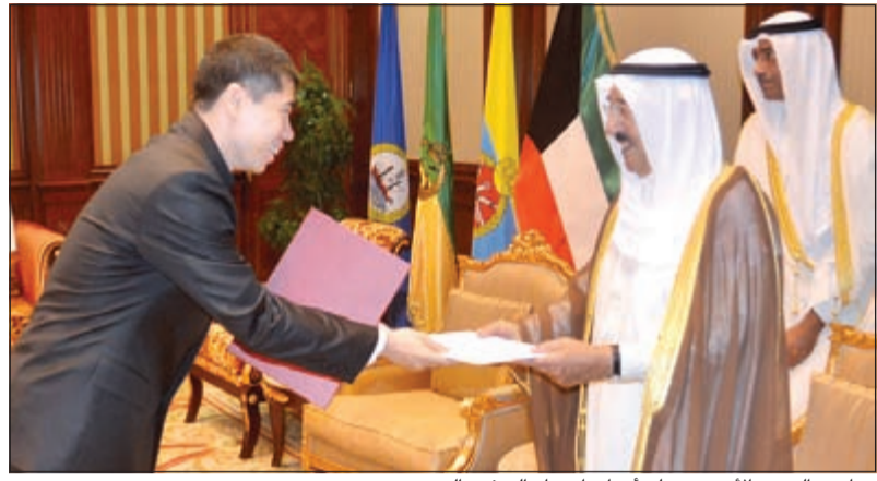
صاحب السمو الأمير يتسلم أوراق اعتماد السفير الصيني