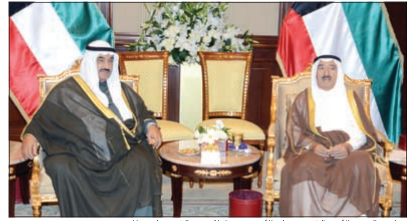
صاحب السمو الأمير الشيخ صباح الأحمد مستقبلاً سمو الشيخ ناصر محمد

وبعث صاحب السمو الأمير الشيخ صباح الأحمد ببرقية تهنئة إلى الرئيس دانيل أورتيغا سافيرا رئيس جمهورية نيكاراغوا خالص عبر فيها سموه عن خالص تهنائه بمناسبة العيد الوطني لبلاده، متمنياً له موقور الصحة والعافية وللبلد الصديق دوام التقدم والازدهار.