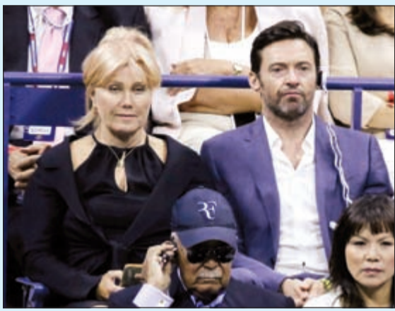
تواجد للممثل الأسترالي هيو جاكمان وزوجته

وتابع ديوكوفيتش الذي يصل الى نهائي جميع البطولات الاربع الكبرى في موسم واحد للمرة الاولى في مسيرته واصبح ثالث لاعب فقط في حقبة الاحتراف يحقق هذا الامر بعد فيدرر بالذات (2006 و2007 و2009) والاسرائيلي رود لايفر (1969)، بأنه يشعر بالفخر لتكمنه من الفوز على غريمه السويسري للمرة الثانية على التوالي في نهائي بطولة كبرى بعد أن تغلب عليه أيضا في نهائي ويمبلدون. ولم تكن المرة الأولى التي يتواجه فيها ديوكوفيتش مع فيدرر في نهائي فلاشينغ ميدوز، إذ إن النهائي الأول للصربي في الفرانك سلام كان في البطولة الأميركية بالذات عام 2007 حين خسر أمام السويسري، ثم خسر نهائي عام 2010 أيضا أمام نادال ورد اعترافه من الأخير عام 2011 قبل أن يخسر نهائي 2012 أمام البريطاني اندي موراي و2013 أمام نادال مجددا. وتأخرت انطلاق المباراة حوالي 3 ساعات بسبب الأمطار لكن هذا الأمر لم يؤثر على ديوكوفيتش كما الحال بالنسبة للمؤازرة الجماهيرية الكبيرة التي حظي بها غريمه السويسري في ملعب «ارثر آش».