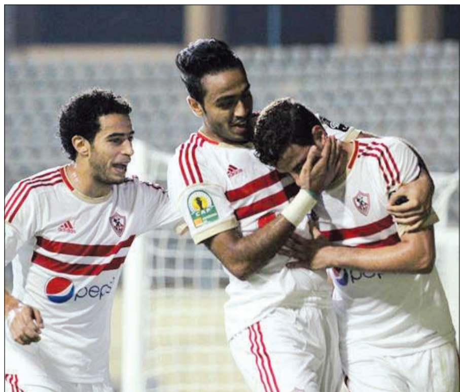
لاعب الزمالك يتبادلون التهنية