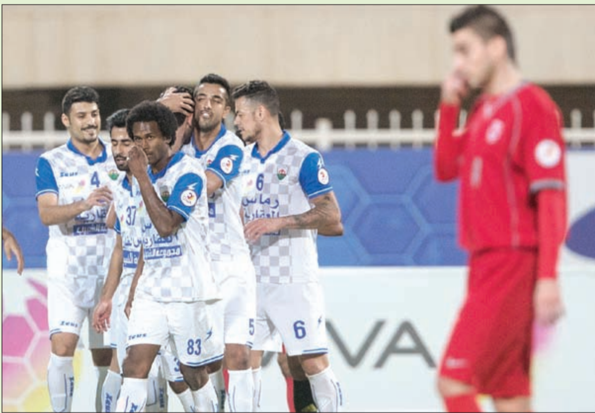
الجهراء حقق نتائج لافتة في الموسم الماضي

● تخصص اهتماما كبيرا لهذه الفرق وهناك إنجازات مميزة لكرة القدم وحققتنا