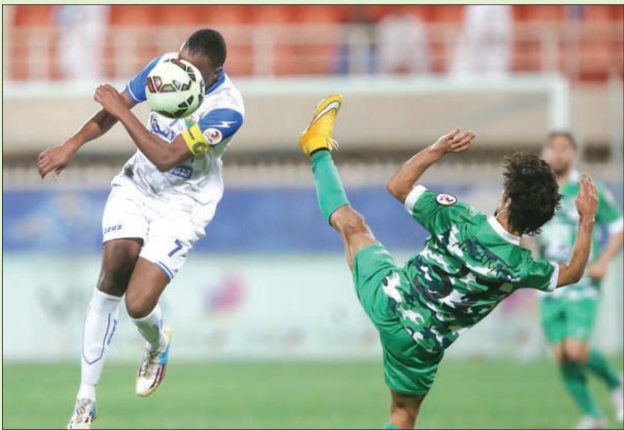
الفريق الكروي بنادي الجهراء يمتلك خامات طبية

اللقاء؟ ● أشكر جريدة «الأنباء» على اهتمامها في الرياضة ونعد محبي الجهراء بتحقيق كل ما يرضيهم في المستقبل ولن نألو جهداً في دعم وتطوير الفرق بكافة الألعاب، وأحب أن أنوه إلى أننا كمجلس إدارة نادي الجهراء وافقنا على اعتماد النظام الأساسي للقانون الجديد ولا توجد لدينا اعتراضات على القوانين التي تضعها الهيئة، وأناشد جميع أعضاء مجلس الأمة من منطقة الجهراء والتجار على دعم النادي.