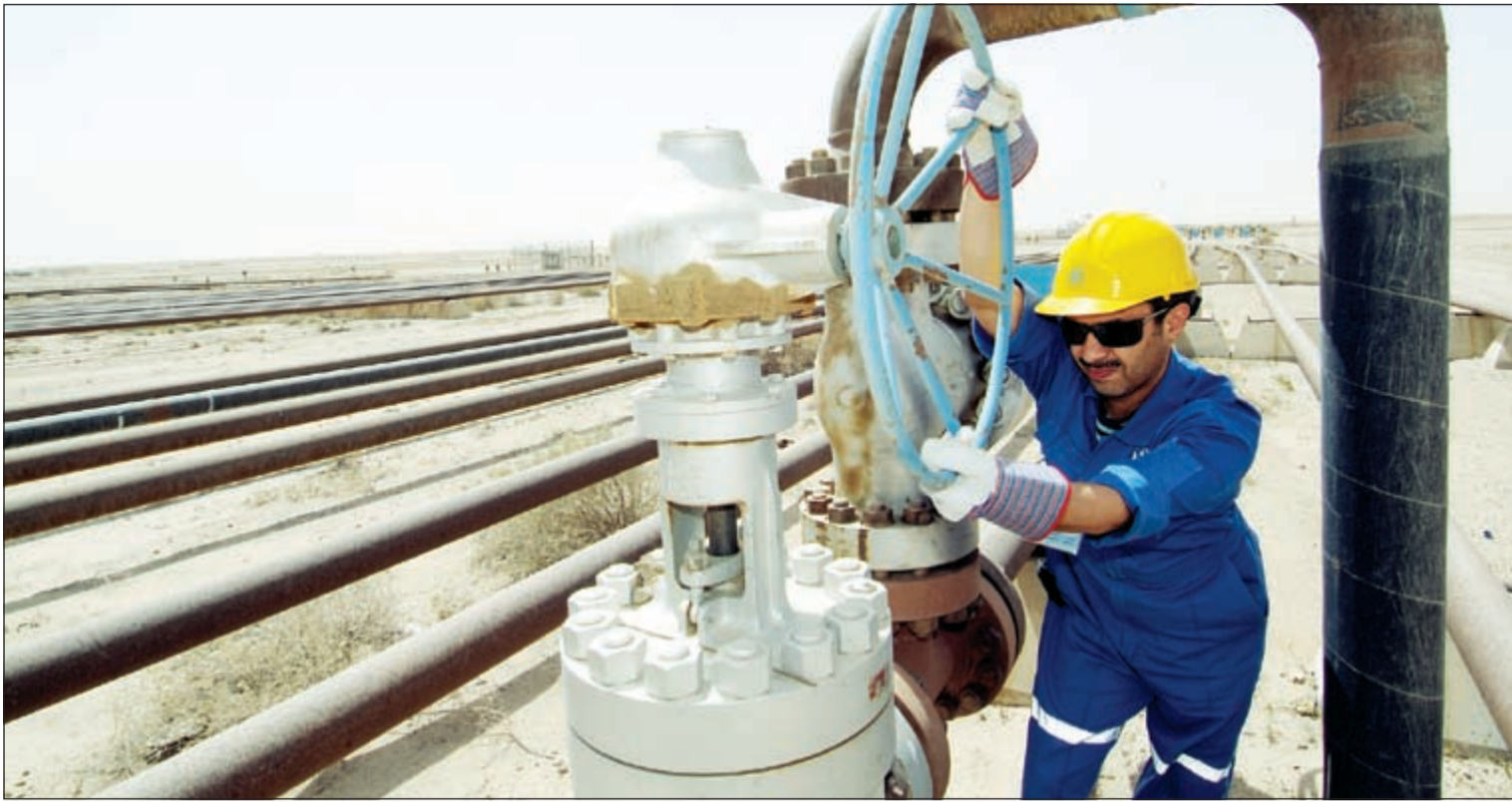
الكويت تتطلع إلى التوسع في إنتاجها ليصل إلى 4 ملايين برميل يوميا بحلول 2020

وأوضح التقرير أن ارتفاع في إنتاج النفط الصخري الأميركي جاء مفاجئا في ظل خفض الإنفاق الرأسمالي