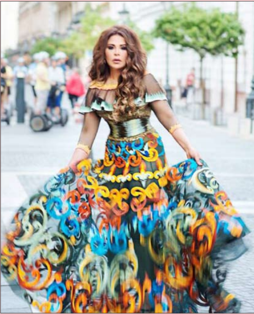
مشهد من كليب أغنية «ابتحداك»