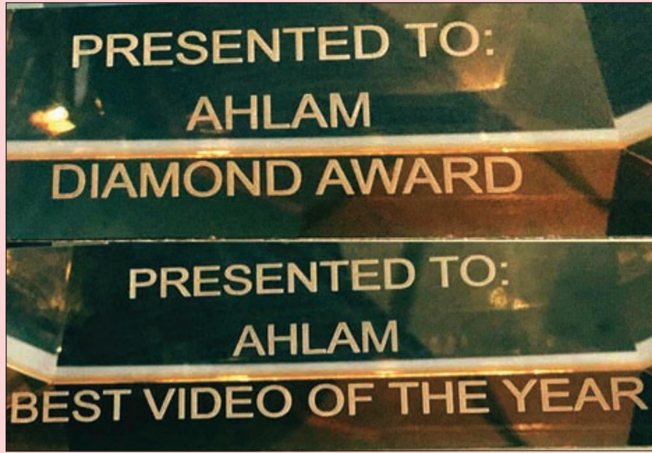
جوائز فنانة العرب العالمية