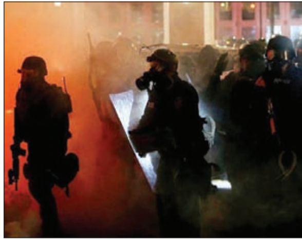
من المظاهرات التي اودت بحياة الشاب الأسود

«رويترز»: ذكرت صحيفة «ديسيريت نيوز» المحلية الأميركية أن امرأة من ولاية يوتا، كان شرطي قد أطلق النار على ابنها الأسود من الخلف وقتله أثناء حملة سيفها العام الماضي، رفضت عرضاً بالحصول على 900 ألف دولار لتسوية دعواها القضائية الاحتادية ضد المدينة وأثنان من رجال شرطتها.