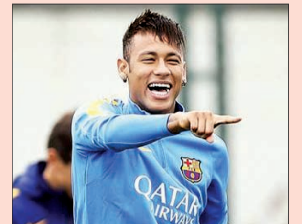
هل يضحك البرازيلي في النهاية؟

أشارت العديد من وسائل الاعلام البريطانية الى ان ادارة برشلونة، قررت بدء محادثات تمديد عقد البرازيلي نيمار دا سيلفا خلال الأيام القليلة المقبلة. ووفقا لصحيفة (ديلي ميرور) البريطانية، فإن ادارة البارسا ورغم انتهاء عقد نيمار