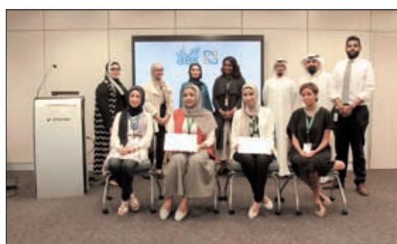
لقطة تذكارية للطلبة المكرمين

ويأتي برنامج التدريب الصيفي ضمن خطة البنك الأهلي الكويتي للمساهمة في تطوير منظومة التعليم وبناء شراكة قوية مع العديد من المؤسسات التعليمية الكبرى في الكويت، ليقدم للطلاب المشاركين تجربة مهمة في مسيرتهم التعليمية.