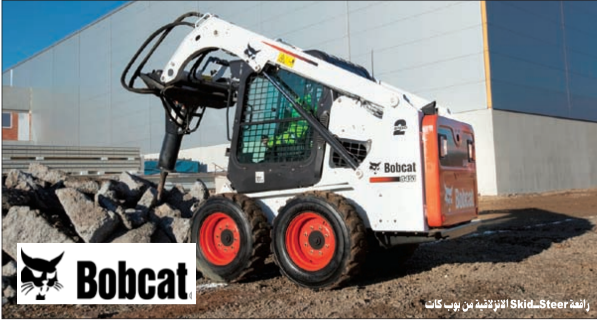
رافعة Skid-Steer الانزلاقية من بوب كات