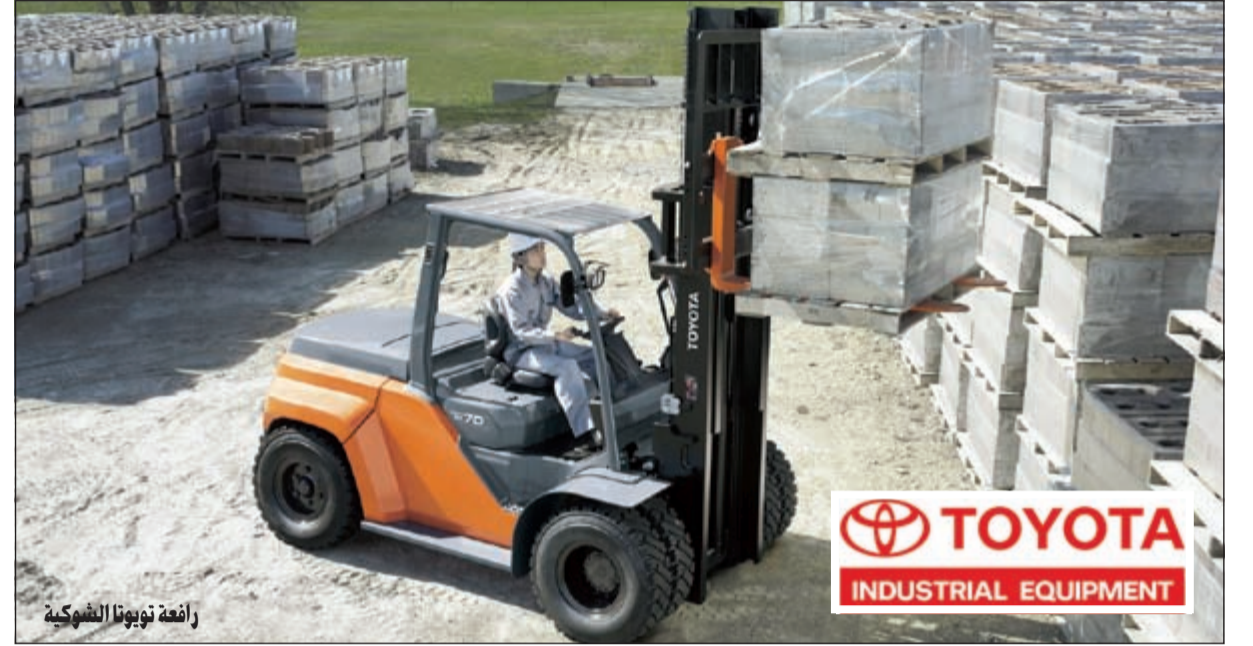
رافعة نويونا الشوكية

وسرعة عالية وتكنولوجيا متطورة للمساهمة في خفض تكلفة عمليات الاعمال، وهي تتناسب جميع الظروف بمستويات عالية استثنائية من خلال متانتها وسهولة قيادتها واقتصاديتها الممتازة والتكنولوجيا صديقة البيئة لضمان الرضا التام من قبل ملاكها، وهي تهدف إلى تقديم جميع أنحاء العالم. وسيتم عرض منتجات شركة بحرة التجارية على المنصة رقم OS700# لمعرض BIG5 2015 في الكويت الذي سيقام على أرض المعارض الدولية في مشرف، أما مواعيد المعرض فتستكون من الساعة 11:00 صباحا حتى 8:00 مساء من يوم الإثنين الموافق 14 إلى يوم الأربعاء الموافق 16 سبتمبر 2015. يمكن الحصول على معلومات شاملة عن المجموعة الكاملة من المنتجات التي توفرها شركة بحرة التجارية جنباً إلى جنب مع المنتجات المعروضة على المنصة.