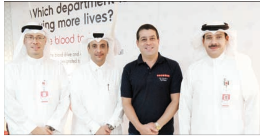
عدد من كبار إداريي الشركة أثناء تواجدهم في حملة التبرع بالدم