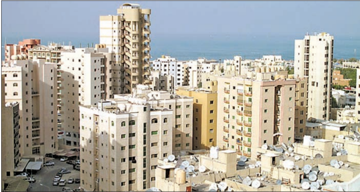
ارتفاع كبير في أسعار الشقق السكنية

قوة نمو الطلب على المواد الغذائية قبل العيد أدت إلى زيادة الأسعار خلال يوليو إلى 4%.