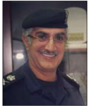
اللواء إبراهيم الطراح

كذلك تم تحرير 73 مخالفة مرورية منها 11 مخالفة وقوف في المواقف المتخصصة للمعاقين كما ضبط على هامش الحملة هندي مطلوب لديونية تقدر بـ 513 دينارا ومواطن مطلوب لـ 11 قضية ويقدر اجمالي المبلغ المدين به المواطن 28 ألف دينار.