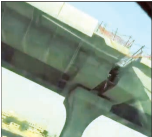
من هنا سقطت الماكينة