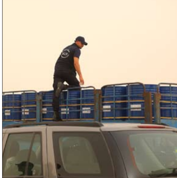
من حملات التفتيش

كل منهم بنقدية صيد «شوزن» وذخيرة من دون ترخيص وجار استمرار دوريات التفتيش في عملها. وأكدت الإدارة العامة لمباحث السلاح إصرارها على تطبيق القانون رقم 6 لسنة 2015 بشأن جمع الأسلحة والذخائر والمفرقات غير المرخصة للوقاية من شرورها وما ينتج عن استخدامها من قبل البعض.