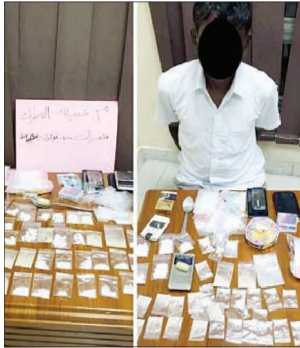
تاجر الهيروين ضبط في الفروانية

ضبط بعد مطاردة في الرقعي وتبين انه يدير وكر لتصنيع المخمور وسرقة الاتصالات، وجاء ضبط الآسيوي عقب الاشتباه به حيث كان يحمل كرتونا تبين ان به خمرًا محليا، ولسدى الاقتراب منه هرب على الاقدام ودخل منزلا وبالدخول الى المنزل تبين انه وكر للمخمور والاتصالات.