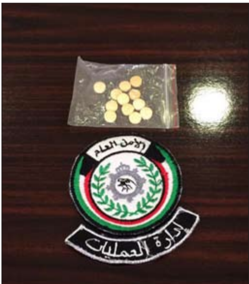
المضبوطات في ايدي «المكافحة»