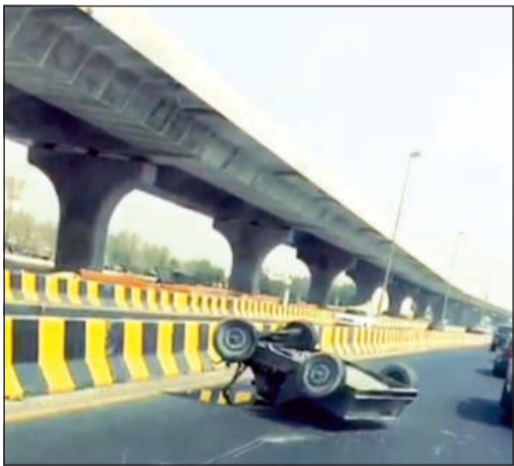
.. وهنا استقرت

كان القدر لطيفا بمرطادي الطريق المؤدي الى الجهراء مقابل أكاديمية سعد العبدالله للعلوم الأمنية، حيث سقطت ماكينة تستخدم في اعمال انشائية بالجسر العلوي الجاري تنفيذه. وبحسب مصدر أمني، فإن مرطادي طريق الجهراء ابلغوا عمليات الداخلية بسقوط مركبة من أعلى جسر، حيث توجه رجال الأمن الى موقع البلاغ وتبين ان الحادث ادى الى تلفيات في جسم الجسر.