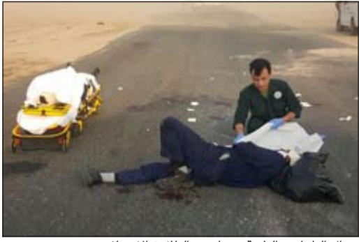
رجال الطوارئ الطبية ينتظرون الطائرة الإسعاف