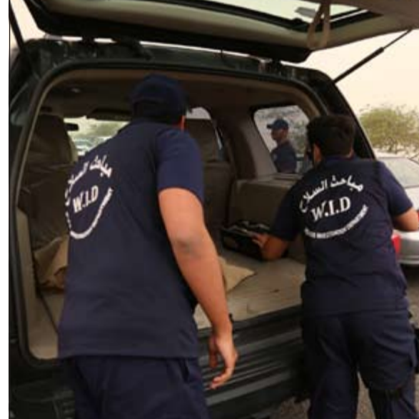
عناصر مباحث السلاح

من خلال توجيه دوريات مباحث السلاح إلى هذه المناطق للبحث عن الأسلحة والذخائر والمفرقات غير المرخصة والتي تم من خلالها وضع عدة نقاط تفتيشية ثابتة ومتحركة، ورصد كل الأشخاص المشتبه فيهم، وذلك بعد استصدار الإذن القانوني من النيابة العامة. وقد أسفرت تلك الحملات عن ضبط 4 أشخاص وبحوزة