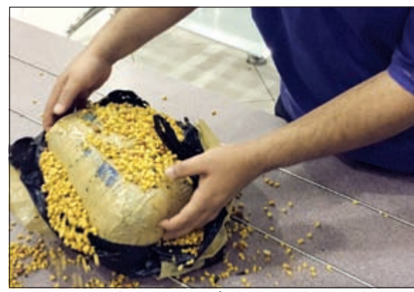
الماريغوانا التي حاول الهندي الإيحاء بأنها مكسرات هندية