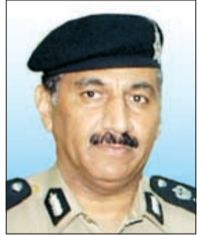
اللواء فهد الشويح

ألقي رجال أمن الفروانية القبض على وافد هندي كان يستقل مركبة مسروقة. وقال مصدر أمني إن رجال الأمن اشتبهوا في مركبة بقيادة هندي وتبين عند الاستعلام عنها عن طريق غرفة العمليات أنها مطلوبة سرقة جنح الأندلس قضية رقم 2015/356، وأحيلت المركبة الى مخفر شرطة الأندلس ومن تم تمت إحالة الوافد الهندي إلى مباحث المنطقة بموجب تعليمات من مدير الأمن اللواء فهد الشويح.