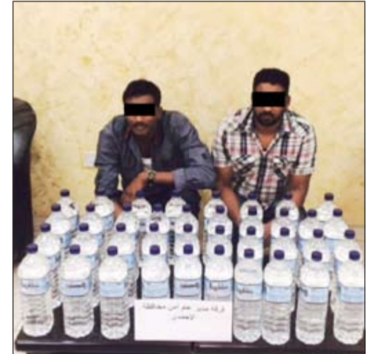
التمتاع وأمامها الخمر المضبوطة