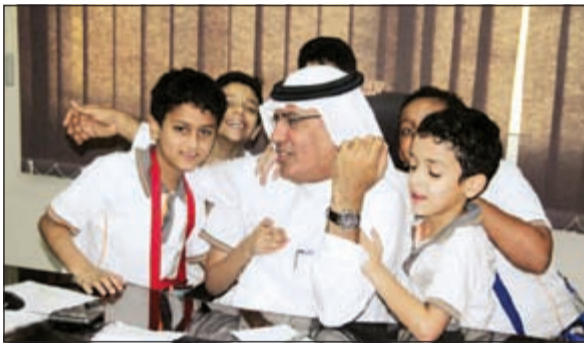
روح الأب والنوحي

نحن بحاجة إلى تأسيس جيل من المعلمين يقدم لهم فكرة التنمية الذاتية والتطوير للقدرات على القائد أن يكون نورا في نفسه حتى يكون نورا يضيء حياة الآخرين