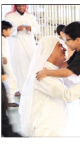
درس في احتواء الطلاب

هنا أتذكر النظرية المعروفة في علم الاجتماع وهي أن الإنسان كائن يؤثر ويتأثر، فالتأثير على الفرد من داخل البيئة أيضا كان حجمها أو تخصصها أو موقعها لابد أن ينعكس ذلك التأثير إلى بيئات أخرى متصلة معها خاصة أننا في زمن أصبح فيه قرية صغيرة واحدة. علاقة التأثير والتأثير ليست مرتبطة بوسيلة المكان إنما هي مرتبطة بوسائل أخرى مثل الاتصال بالتقنيات الحديثة، وسرعة حركة البشر من موقع إلى آخر على مدار الوقت الذي يعيشه هذا الإنسان، والتأثير الآخر هو أن القيام بالأنشطة الإيجابية في المدرسة من المبدئي أن يكون له محاكاة مع مدارس أو جهات تربوية أخرى، بل أيضا تتعدى ذلك أحيانا في مواقع مع مؤسسات كثيرة ترتبط بالمجتمع المدني مثل: الأندية الرياضية والمنتديات الاجتماعية المختلفة.