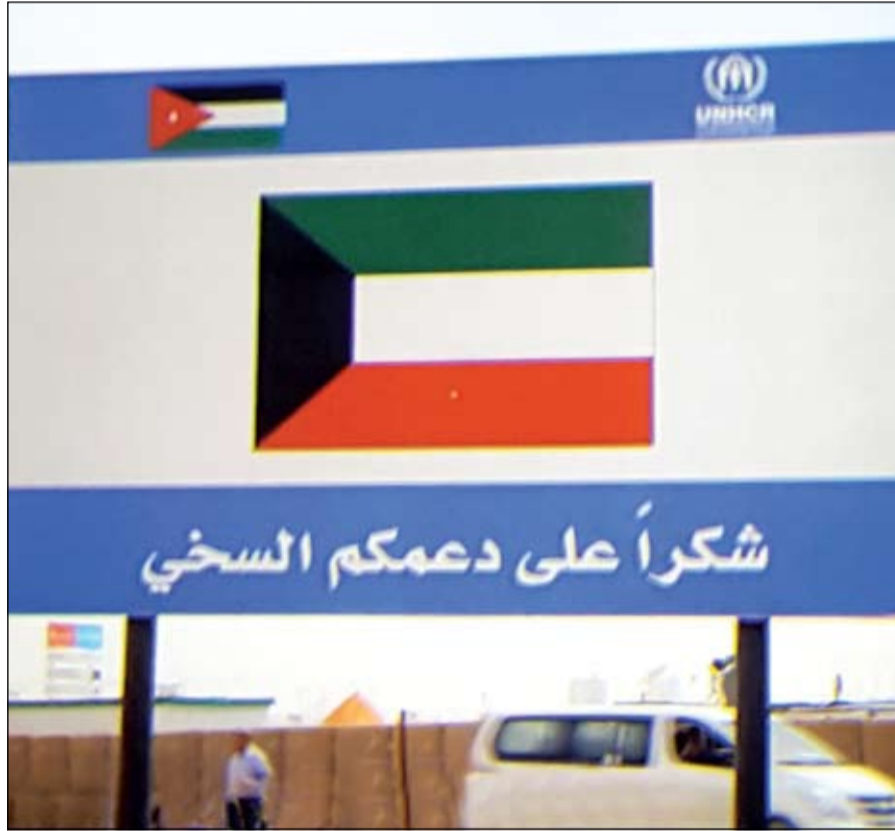
مشهد من «الكويت في الخط الأمامي للعمل الإنساني»

في عام 2004، اذ كانت الكويت من اوائل دول العالم حضورا لموقع الكارثة وكذلك جهودها المميزة في مكافحة الاوبئة والأمراض في العالم واهمها وباء ابولا في القارة الأفريقية قبل عامين. وتطرق الفيلم ايضا للدعم السخي الذي قدمته الكويت للاجئين السوريين من خلال استضافتها لثلاث مؤتمرات دولية للمناحدين بمشاركة