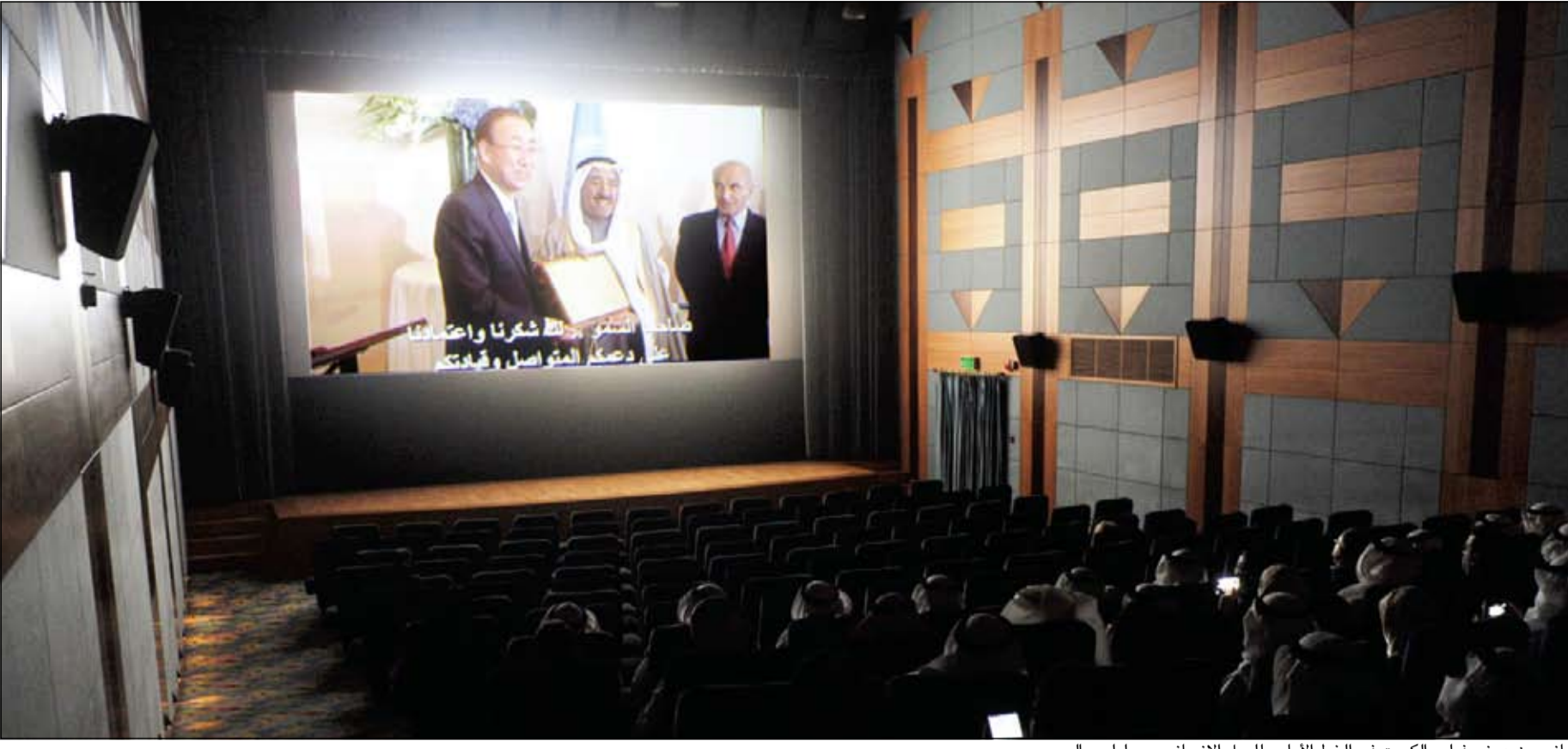
جانب من عرض فيلم «الكويت في الخط الأمامي للعمل الإنساني» بـ «ليلي جاليري»