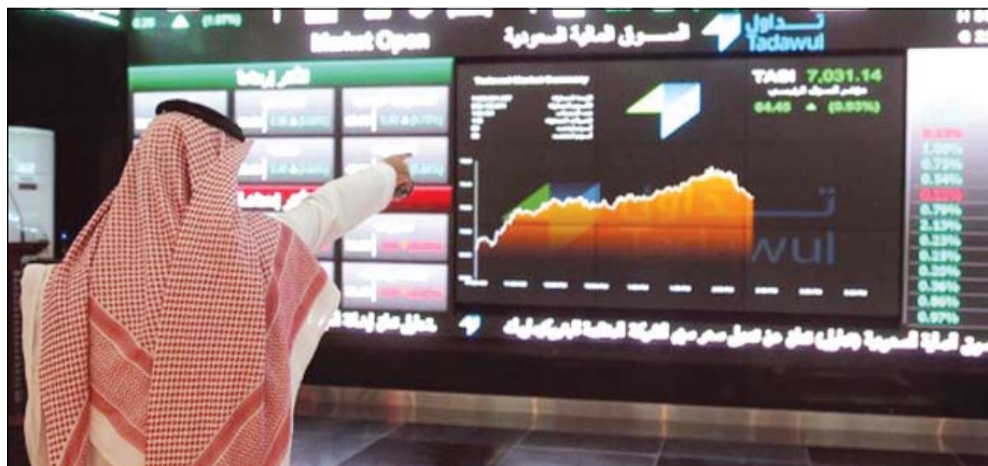
انطلاق نظام التداول الجديد الأحد القادم بعد إتمام كل المراحل التجريبية

أعلنت السوق المالية السعودية أمس أنه تم إلغاء جميع الأوامر القائمة وغير المنفذة في النظام الحالي للتداول بنهاية جلسة الخميس، وإنهاء كل الإجراءات والمتطلبات، استعدادا لبدء تشغيل نظام التداول الجديد «X-stream INET»، مضيفة أنه سيتم استئناف استقبال الأوامر الجديدة اعتبارا من الأحد المقبل. وحسب «أرقام» سيطلق نظام التداول الجديد «X-stream INET» صباح يوم الأحد القادم بعد إتمام كل المراحل التجريبية والتأكد من جاهزية الفنية والتقنية للنظام وربطه مع جميع أنظمة أعضاء السوق ومزودي خدمات معلومات السوق. ويعد النظام الجديد من أحدث أنظمة التداول التي طورتها شركة (NASDAQ)، والذي يتميز بفاعليته وسرعته في تنفيذ الأوامر بشكل دقيق وآمن، وذلك في تداول الأسهم، الصكوك والسندات، وصناديق المؤشرات.