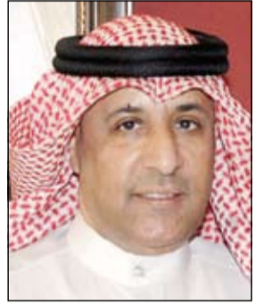
السفير عزيز الديحاني

صباح الأحد والإشادة، بدور سموه ومكانة الكويت في العمل الإنساني، خاصة مع وجود أوضاع في العالم العربي، وكثير من المجتمعات تتطلب أن تتضافر من أجلها الجهود لتقديم المساعدة وبد العون. ولفت الديحاني إلى أنه وجد «اهتماماً كبيراً من الدول العربية خلال اجتماع مجلس الجامعة مع الذكرى الأولى لقيام صاحب السمو الأمير سموه قائداً للعمل الإنساني وتكريمه على المستوى الدولي ولاختيار الكويت مركزاً للعمل الإنساني».