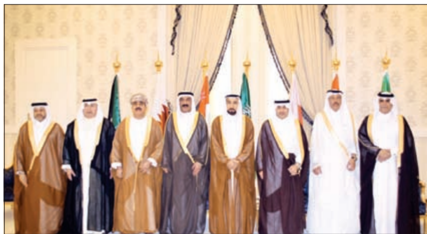
وكلاء وزارات الداخلية في دول مجلس التعاون