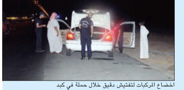
إخضاع الركبات لتفتيش دقيق خلال حملة في كبد

السلاح المقدم حمد العجمي دلت على اثنين من المواطنين يحوزان ويحترزان أسلحة غير مرخصة. ويعد تكثيف التحريات واتخاذ الإجراءات القانونية اللازمة، تم ضبط المواطنين ويحوزتهما الأسلحة والذخائر في مركبة كل منهما بمنطقة كبد. وتمت إحالة المتهمين والمضبوطات إلى جهة الاختصاص.