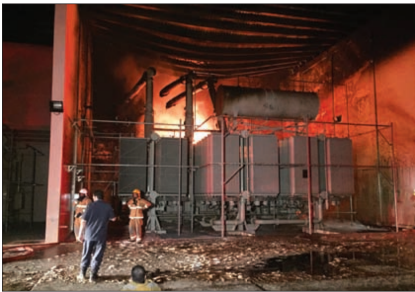
المحول الكهربائي بعد ان تعامل رجال الاطفاء مع الحريق

الرياض - كونا: دعا وكيل وزارة الداخلية الكويتية الفريق سليمان الفهد امس الى تعزيز الروابط الأمنية المشتركة لدول مجلس التعاون الخليجي للمساهمة في تحسين القدرات الأمنية في مواجهة الإرهاب ومجابهة الجريمة بجميع أشكالها ووأدائها في مهبدا. وقال الفريق الفهد في كلمته القاها خلال افتتاح اجتماع وكلاء وزارات الداخلية لمجلس التعاون لدول الخليج العربية انه خلال السنوات الأخيرة شهدت المنطقة والعالم تغييرا في البيئة الأمنية. وأضاف «أن الأمن الخليجي يتأثر إذ مرت على دوله مؤخرا أحداث إرهابية غاية في الصعوبة وقعت في بعض دولنا حاول خلالها الإرهابيون غرس بذور الفتنة بين أبناء