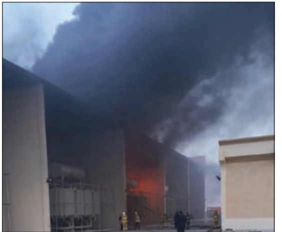
التيران مشتعلة وسحب الدخان تصاعد من الحريق