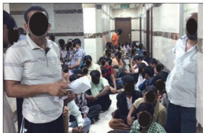
مخالفو قانون الإقامة