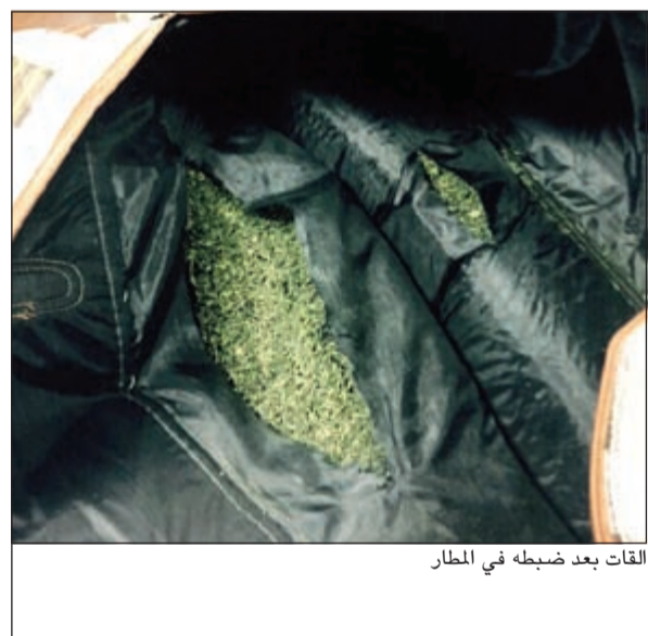
القات بعد ضبطه في المطار

أكدت الإدارة العامة للمرور قيامها بوضع آلية جديدة لرصد المخالفين والحد من تجاوزات أصحاب المركبات التي تحمل لوحات خليجية من المواطنين الكويتيين، وذلك بعدما لوحظ اعتماد أغلبهم ارتكاب المخالفات المرورية في ظل عدم وجود قاعدة بيانات