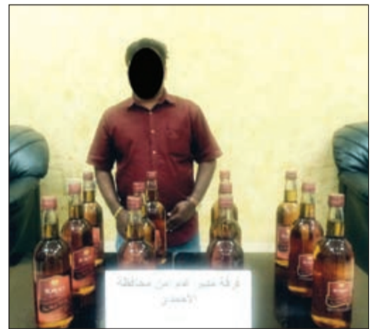
الخمر المستوردة المضبوطة في الاحمدي ويبدو احد التجار