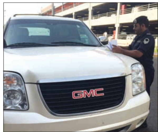
مخالفة في موقف المستشفى