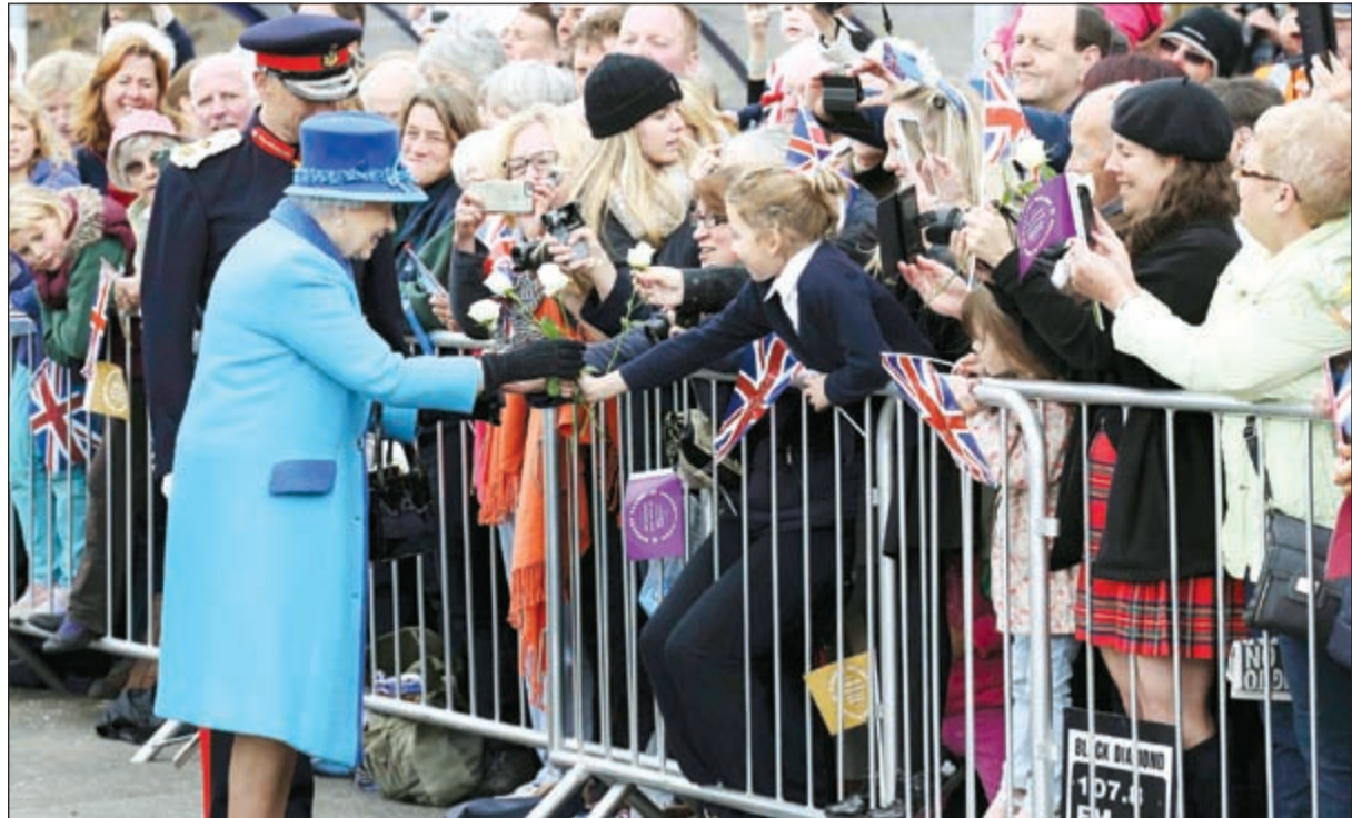
ملكة بريطانيا تتلقى الزهور لدى افتتاحها أمس محطة قطارات نيوتونترانج في اسكتلندا

وقد أشاد رئيس الوزراء ديفيد كامبرون بالملكة «العظمى» للبريطانيين» في بقائها على العرش واصفا إياها بروح بريطانيا النابضة.