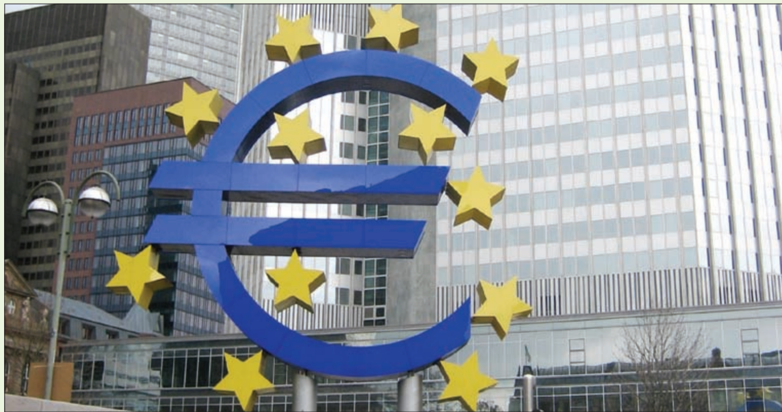
مقر البنك المركزي الأوروبي

خلال الفترة الحالية مقارنة بالعام الماضي. وأشارت الاستشارة الألمانية إلى أن دول منطقة اليورو التي قامت بتنفيذ إصلاحات كبيرة، مثل إسبانيا، وإيرلندا تسجل حاليا معدلات نمو أعلى من المتوسط في المنطقة.