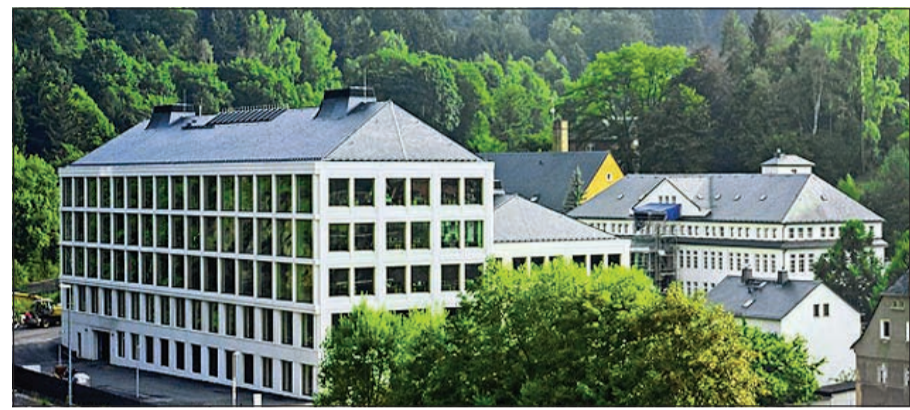
مبنى مصنع شركة إيه. لانغيه آند صونه الجديد في غلاشوتة

أهم ماركات صناعة الساعات الفاخرة في العالم مرة أخرى. واكتسبت ألمانيا الشرقية سمعتها الجيدة بانها موقع من إبداع وحديث من خلال قصص النجاح التي تحكي قصة نجاحنا. كما أنني رئيس وزراء مقاطعة ساكسونيا ستانيسلاف تيليج على الروح الإبداعية التي تتمتع بها هذه الشركة قائلاً: «إيه. لانغيه آند صونه هي شركة مشهورة عالمياً بثروتها التقليدية، ولطالما حافظت على أسطورتها رغم جميع الصعاب، فاليوم، يبدأ فصل جديد من النجاح مع المبنى الجديد مع مساحات شاسعة للكثير من التقاليد والحداثة المعاصرة». ويُعد المبنى الجديد مع منطقة الإنتاج الخاصة به