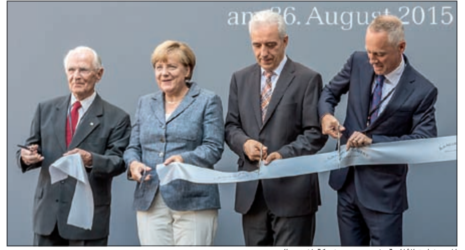
المستشارة الألمانية تفتتح مبنى شركة لانغيه الجديد

الافتتاح الرسمي لمبنى المصنع الجديد الخاص بشركة إيه. لانغيه آند صونه