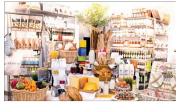
«دين & ديلوكا»، تقدم تجربة تعلم مهارات تحضير الأطعمة

كما سيشهد هذا الحدث فعاليات أخرى كتقديم نصائح للتذوق ودورات الطبخ المقدمة من أشهر الطهاة وشركات تصنيع الأغذية، بالإضافة إلى عرض مجموعة من منتجات «دين