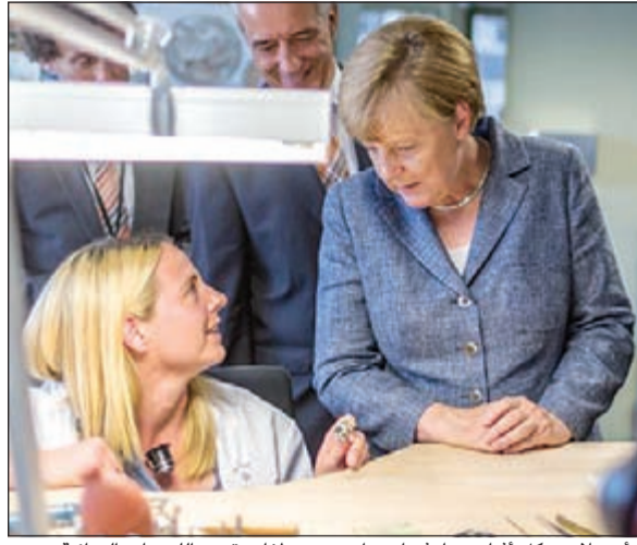
دانييلا ميركل أثناء محادثتها مع إحدى موظفات قسم المسامات النهائية