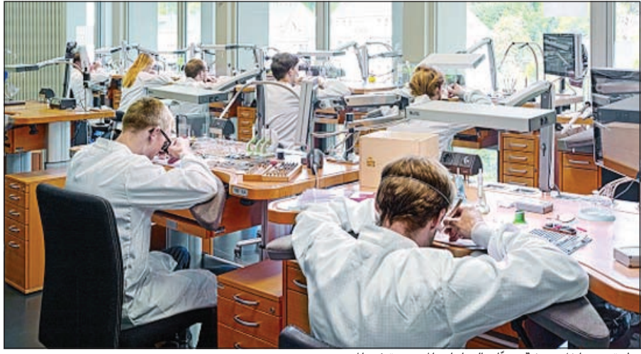
نظرة من داخل ورشة صناعات الساعات الموجودة في المبنى