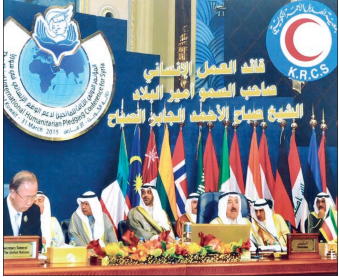
غلاف كتاب قائد العمل الإنساني