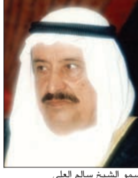
سمو الشيخ سالم العلي

المعتمدة. وأشار م. الشمري إلى أن جائزة سمو الشيخ سالم العلي للمعلوماتية كانت قد واكبت الحدث الأممي بتسمية صاحب السمو الأمير الشيخ صباح الأحمد، قائداً للعمل الإنساني وتسمية الكويت مركزاً للإنسانية بإصدار تطبيق منصة الشيخ صباح الأحمد للعمل الإنساني في 2015/9/9. وأكد أن تطبيق المنصة أطلق باللغة الإنجليزية أيضا بعد أيام قليلة من تدشين النسخة العربية، لتمكين غير الناطقين باللغة العربية من التعرف على مسيرة العمل الإنساني في الكويت وجهود صاحب السمو، وتسجيل