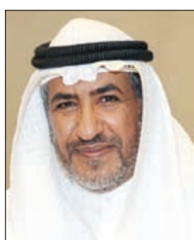
د. ناجي المطيري

ولقب قائد العمل الإنساني لصاحب السمو الأمير اعترافاً بدمجه المستمر وقيادته الاستثنائية للعمل الإنساني للأمم المتحدة ورفع العناية عن المحتاجين في جميع دول العالم، وإشارة الأمين العام المهمة أن «الكويت أظهرت كراماً استثنائية تحت قيادة صاحب السمو الأمير ورغم صغر مساحة البلاد إلا أن قلبها كان أكبر من الأزمات والفقر والأوبئة»، ولفت إلى أن إقامة الأمم المتحدة احتفالاً خاصاً بهذه المناسبة بحضور ممثلي الدول الأعضاء والمنظمات الدولية وعدد كبير من الشخصيات العامة يعكس أهمية هذا التكريم والمكانة