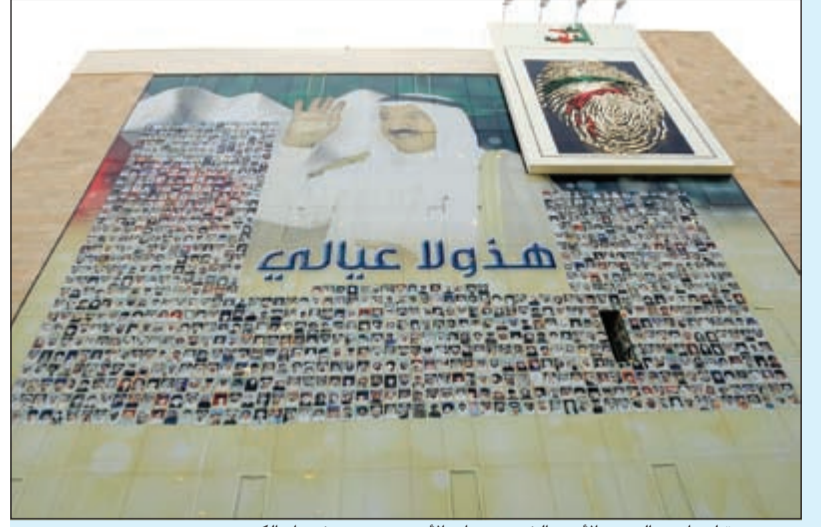
صورة لصاحب السمو الأمير الشيخ صباح الأحمد وصور شهداء الكويت

الأول: يتعلق بالرواد، وهم شخصيات كانت لها بصمات واضحة في العمل الإنساني في الوطن العربي والعالم أجمع، وكل من بذل الجهد والوقت والمال في سبيل خدمة القضايا البشرية، حيث سيتم توثيق أعمالهم وبصماتهم. والثاني: يتحدث عن