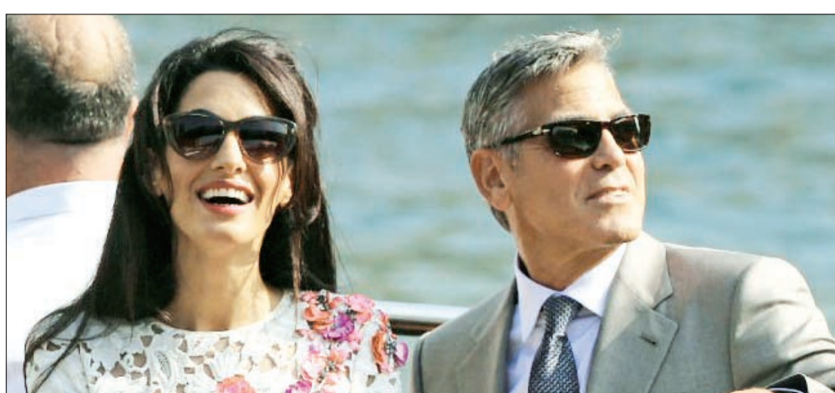
كلوني وأمل علم الدين

وكالات: أعلن النجم السينمائي جورج كلوني عن تبنيه هو وزوجته اللبنانية أمل علم الدين لطفل سوري بعد ان فقد والديه في الأحداث المؤلمة الاخيرة. حيث سيطرت حالة من الحزن الشديد على نجوم الفن الغربي عقب الحادث الاليم الذي تعرض له عدد كبير من اللاجئين السوريين على مدار الأيام الماضية، وهو الأمر الذي تناقلته جميع وسائل الإعلام المرئية والمقروءة فور العثور على جثة طفل رضيع على أحد الشواطئ مما أثار غضب عدد كبير من نجوم العالم، وكان على رأسهم جورج كلوني. وأعرب كلونسي عن بالغ أسفه لما يحدث في المنطقة العربية، مشيراً إلى أن هذه الأحداث المأساوية يروح ضحيتها الأبرياء، وتابع قائلاً: «علينا التركيز جميعاً والنظر في مسألة المدنيين العزل واللاجئين، فهي أقل ما يمكن أن نقدمه لهم في ظل ما يحدث على الساحة، وسوف أعمل جاهداً على مساعدة هؤلاء اللاجئين السوريين دون التفرق إلى المجال السياسي فهو ليس من اختصاصي، ولكن للفن دوراً قوياً في تبني مثل هذه القضايا والتأثير فيها». وأضاف: «الصراع الدائر في سورية تطور منذ بدء الاحتجاجات ضد حكومة الرئيس بشار الأسد، قبل أربع سنوات، إلى حرب مغلقة للغاية لن تنتهي بل اشتدت رحاها مؤخراً».