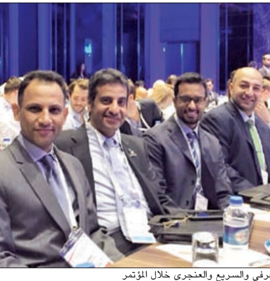
معرفي والسريع والعنجري خلال المؤتمر

شارك الوفاء الكويتي بعضوية اقتصاد رواد الأعمال الخليجي في مؤتمر المقام بالعاصمة التركية «استنبول» بالفترة من 7 إلى 9 سبتمبر. ويقام هذا المؤتمر سنوياً والتي تستضيفه إحدى الدول العشرين الأساسية، وتأتي مشاركة الكويت بعضويتها التي تقرأها صندوق المؤونة ومقرها المملكة العربية السعودية أحد المؤسسات التي لها دور كبير وفعال في الملتقى، حيث يجمع الملتقى ما لا يقل عن 500 رائد أعمال من أكثر من 40 دولة وأكثر