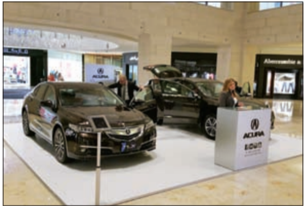
أكورا في مجمع «360 مول»