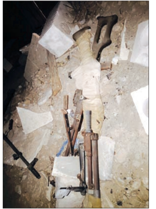
الاسلحة التي عثر عليها