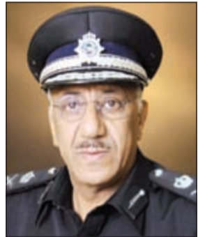
اللواء فيصل السنين

قال مدير عام الإدارة العامة لأمن المطار اللواء فيصل السنين ان حركة المسافرين خلال الفترة من 2015/8/31 عبر إدارة جوازات المطار بلغت 1,173,186 مسافراً، وإجمالي عدد المغادرين والقادمين من مواطني دول مجلس التعاون لدول الخليج العربية بلغ 61,453 ألف مسافر، لافتاً إلى أن عدد المواطنين القادمين والمغادرين بلغ 508,003 آلاف مسافر، أما باقي الجنسيات فبلغت 576,730 ألف مسافر.