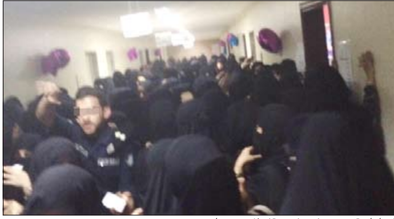
الضابط وقد وضع نفسه في موقف لا يحسد عليه

كذلك التي كان الضابط الالفت خصوصا مع وجود الشرطة النسائية يفترض ان تقوم باي مهام الأساس.