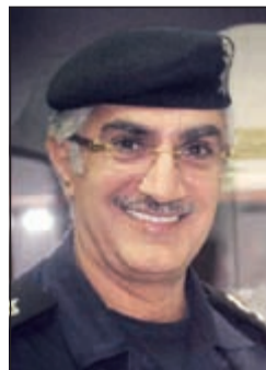
اللواء إبراهيم الطراح