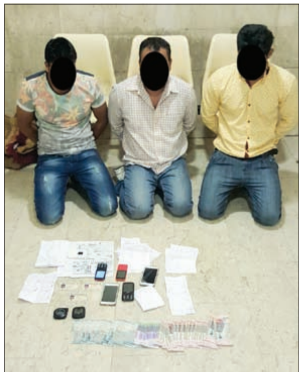
المقامر وناسمهم أدوات اللعب